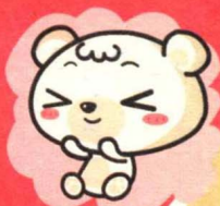
白色的熊叫北极熊