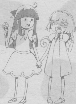
男扮女装的白天和巴豆