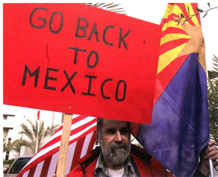
移民，尤其是非法移民，加剧了美国部分地区的民族仇恨

岁上下了，估计那时美国将再增加 1 亿人口，总人口达到 4 亿。和增加的 1 亿人口共存，那时的中年生活会是什么样呢？如今的社会问题会得到解决或改善吗？还是会变得更糟？请考虑以下这些因素：