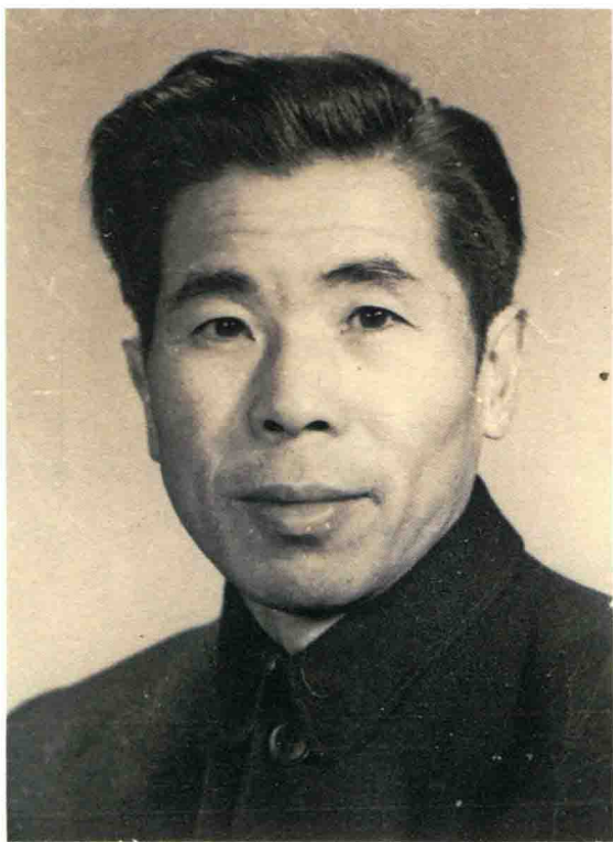
冯契 (1915年11月4日—1995年3月1日)