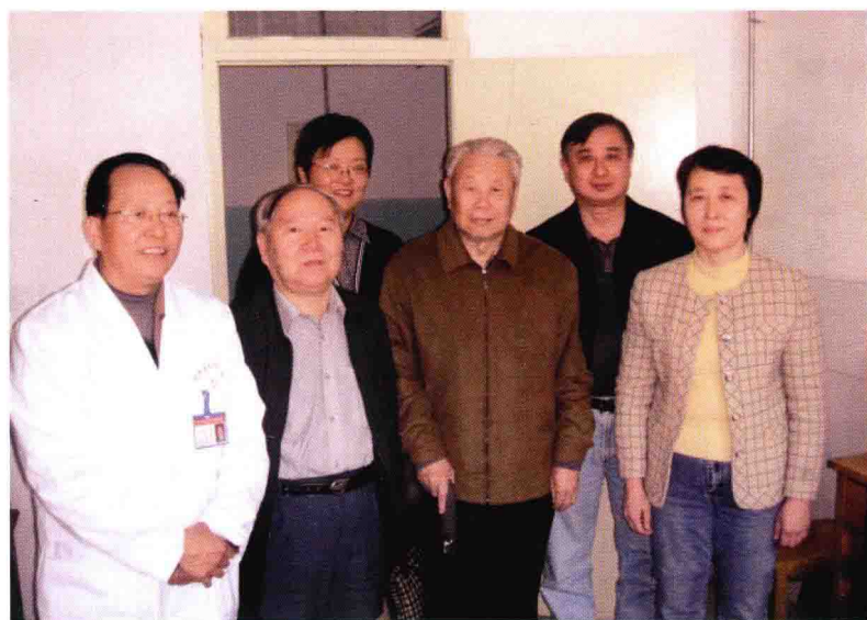
国家中医管理局、省局及院领导和谢老在一起（右三）