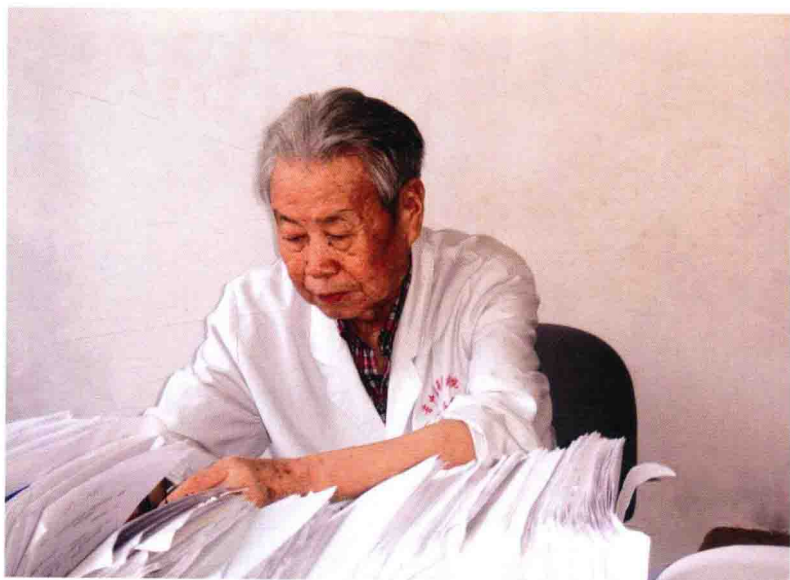
谢老在门诊工作中