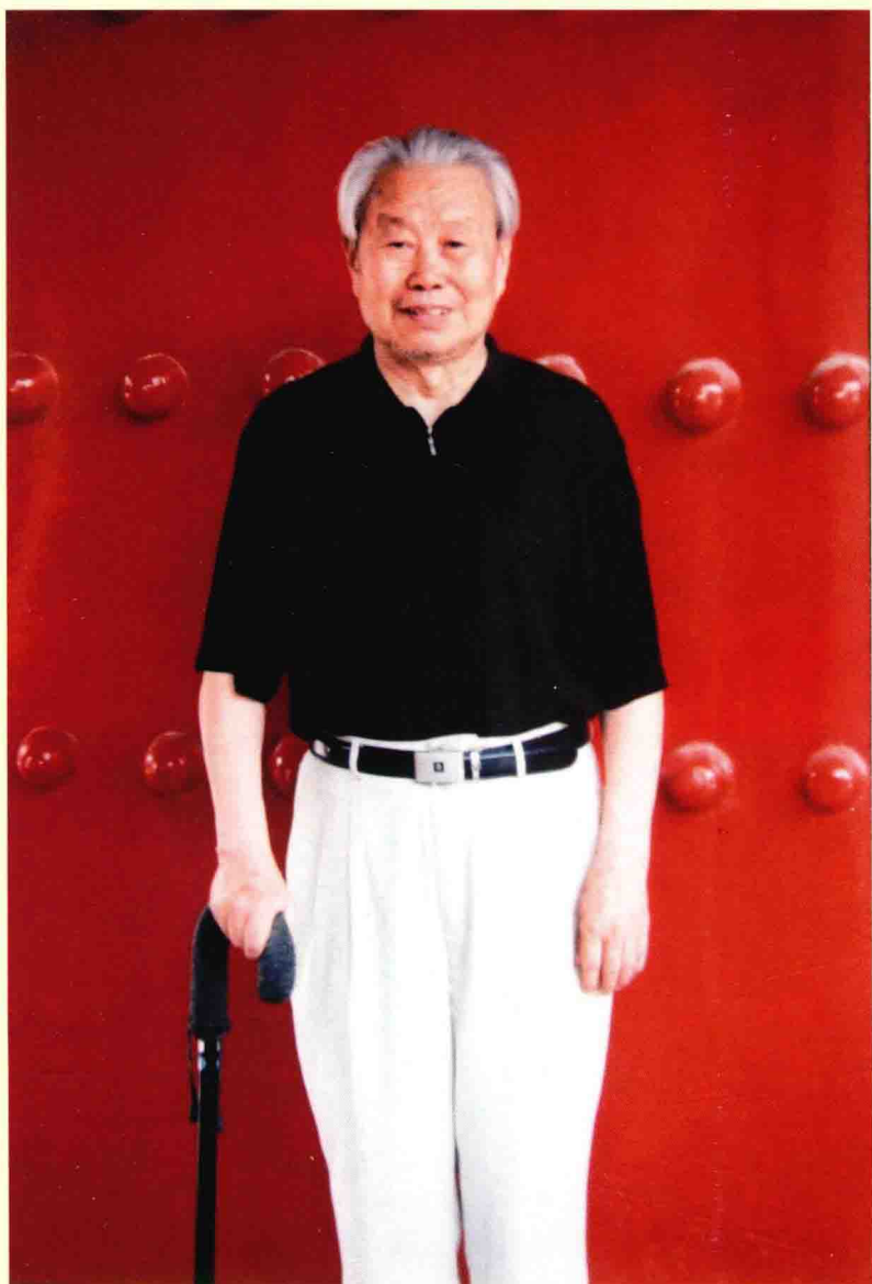
国家级名老中医谢远明