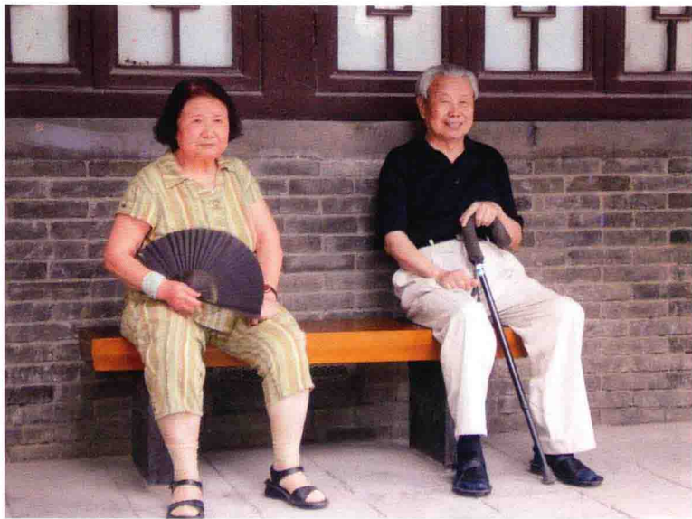
谢老和夫人生活照（左二）