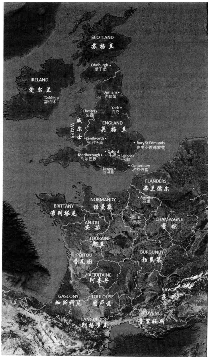
图一 13世纪英国及其周边地区（本图由蔺志强根据谷歌地图并结合本书内容制作）