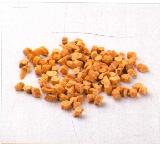
● 蒙古黄芪的根细长，切开后有明显的菊花心，呈黄色，味微甜，闻之有比较浓的豆腥味。

蒙古黄芪的托叶离生，呈卵形、披针形或线状披针形，长4~10毫米，下面被白色柔毛或近无毛；小叶呈椭圆形或长圆状卵形，长7~30毫米，宽3~12毫米，先端钝圆或微