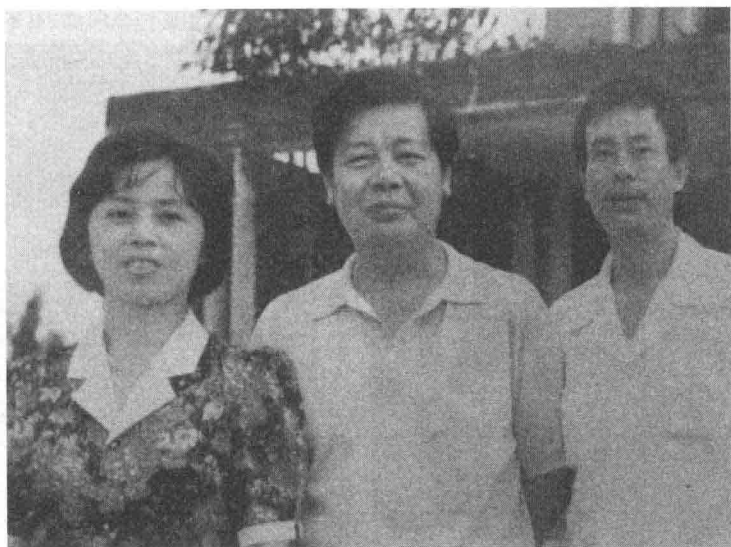
与家人合影，中为作者