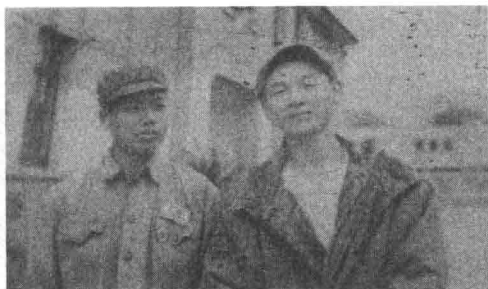
《没有航标的河流》被拍摄成电影