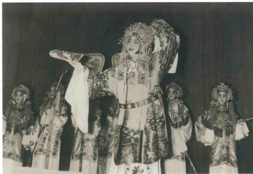
梅兰芳《贵妃醉酒》戏照，20世纪50年代初