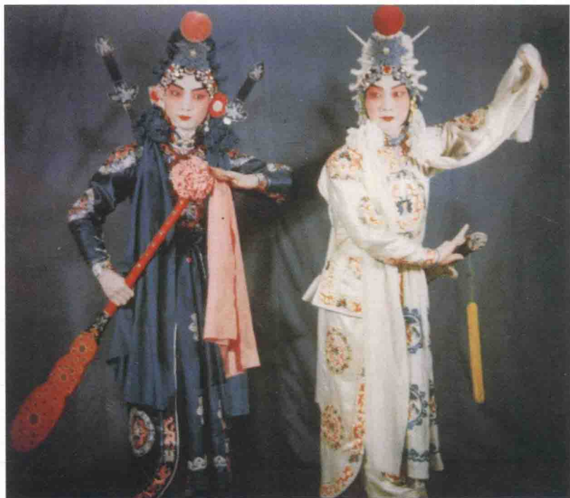
梅兰芳《白蛇传》戏照，梅葆玖饰青儿