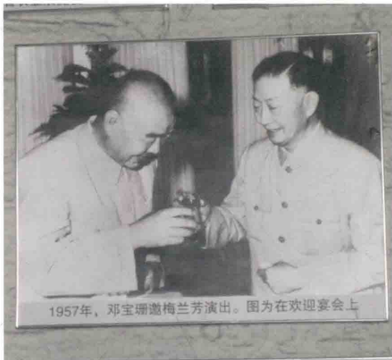
1957年，邓宝珊邀梅兰芳演出。图为在欢迎宴会上