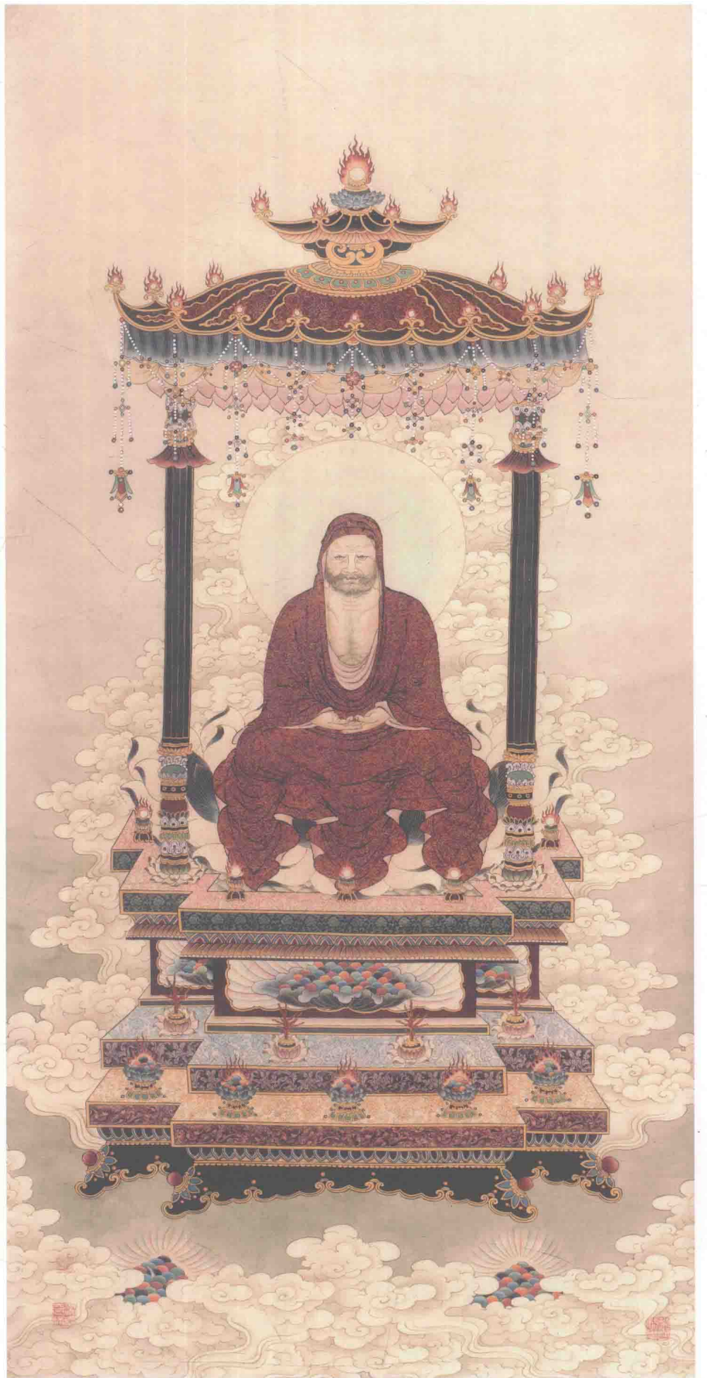
© 达摩端坐结跏趺 2001年 绢本设色 139cm × 70cm