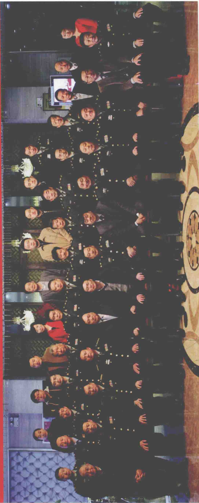
《中华战创伤学》第三次主编会议参会人员合影