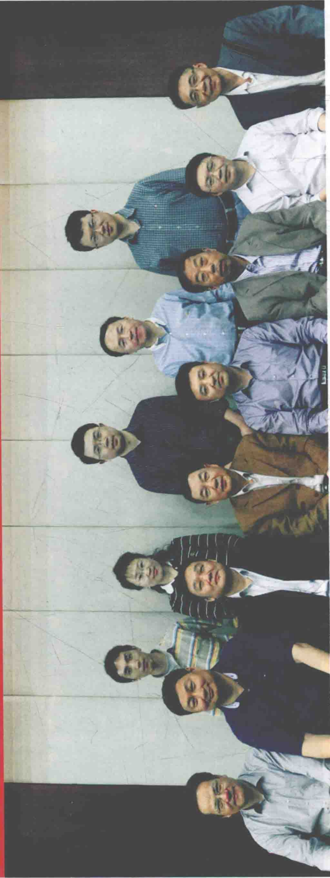
《中华战创伤学》第一次主编会议参会人员合影