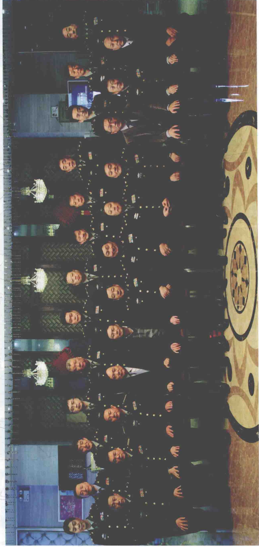
《中华战创伤学》总主编付小兵院士与分卷主编合影