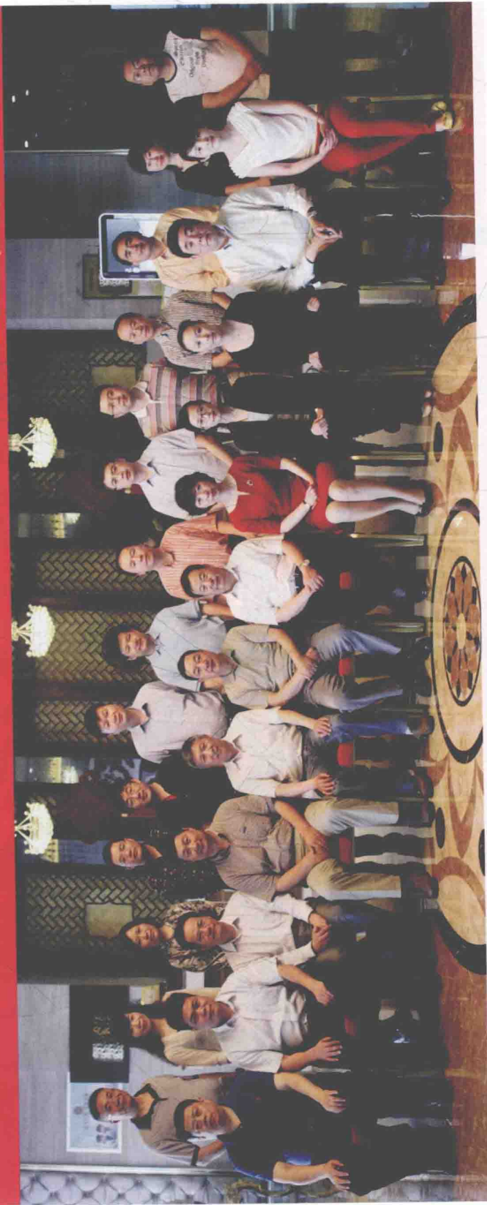
《中华战创伤学》第二次主编会议参会人员合影