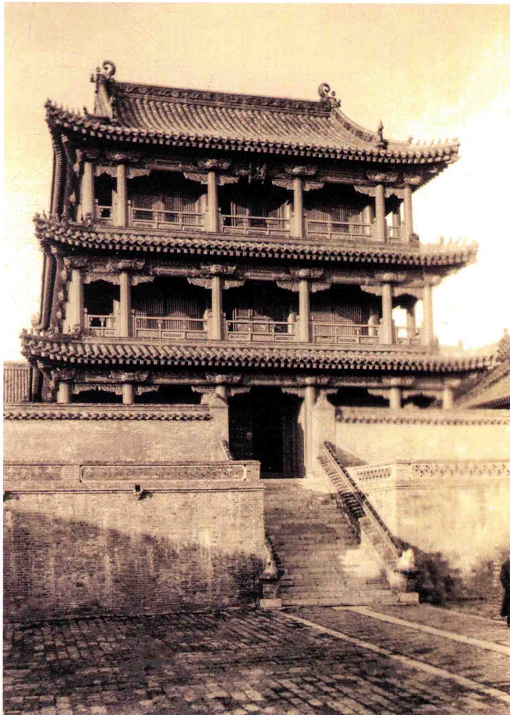
奉天（今沈阳）故宫凤凰楼 > The Fenghuang Tower in the Mukden (Shenyang) Palace