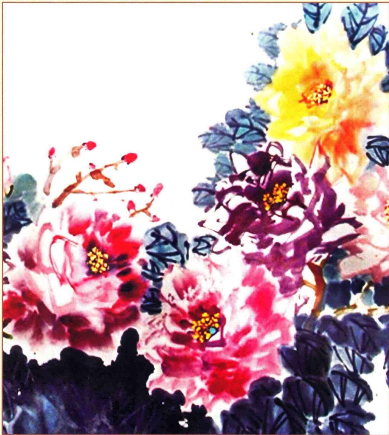
一片异香天上来（局部）