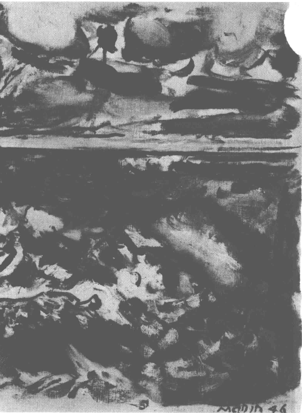
⊕ 2 | 变动、天空与大海 (Movement, Sky and Sea) | 约翰·马林 (John Marin)