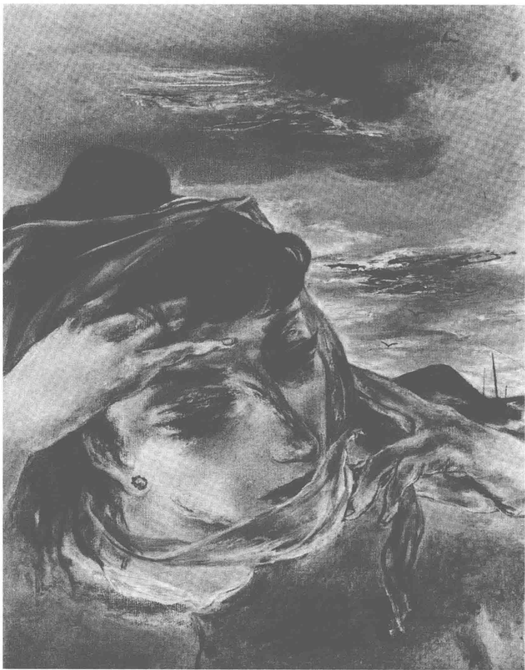
⊕ 3 | 未雨绸缪 (Thinking Ahead) | 国吉康雄