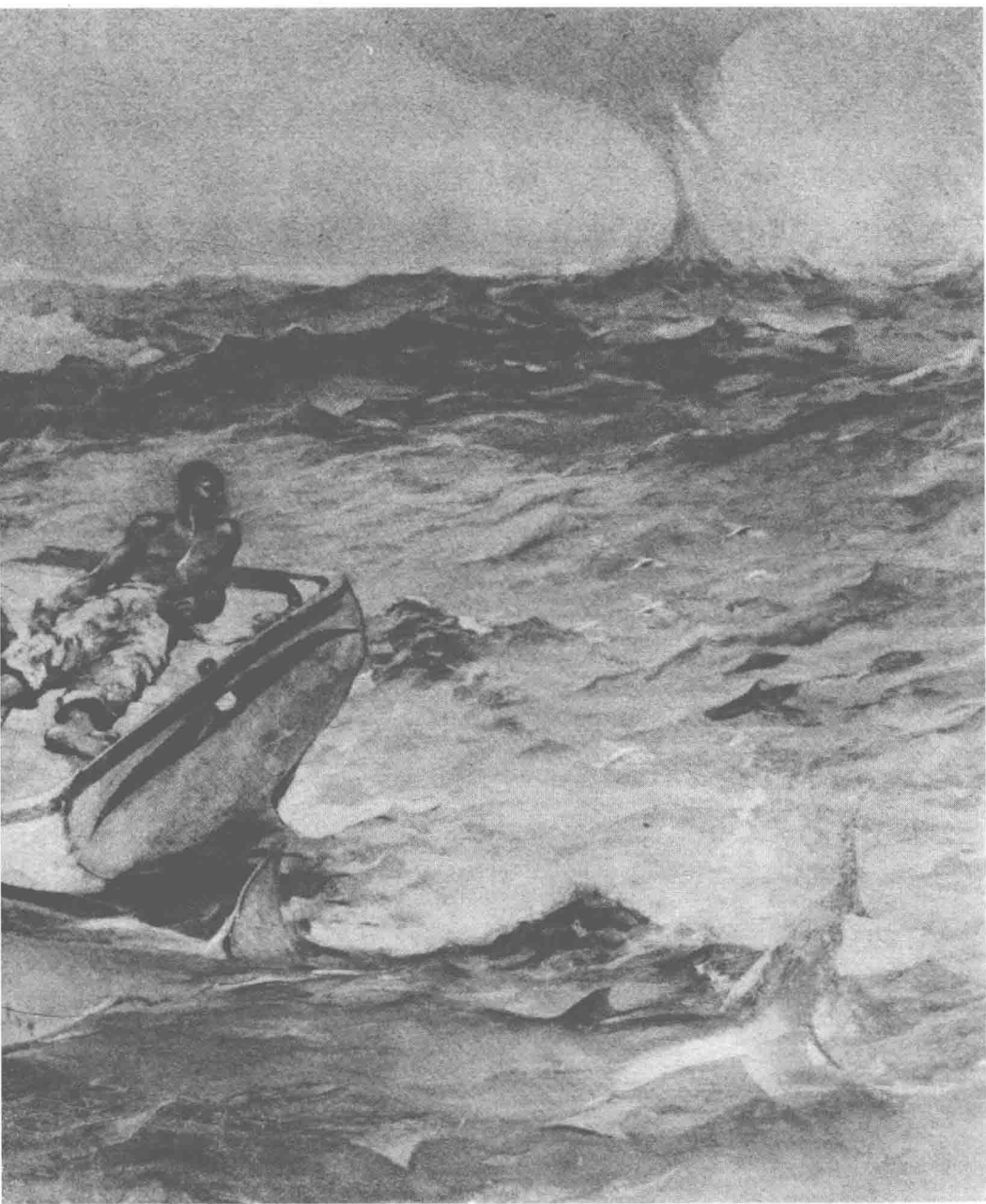
⊕ 1 | 海湾激流 (The Gulf Stream) | 温斯洛·荷马 (Winslow Homer)