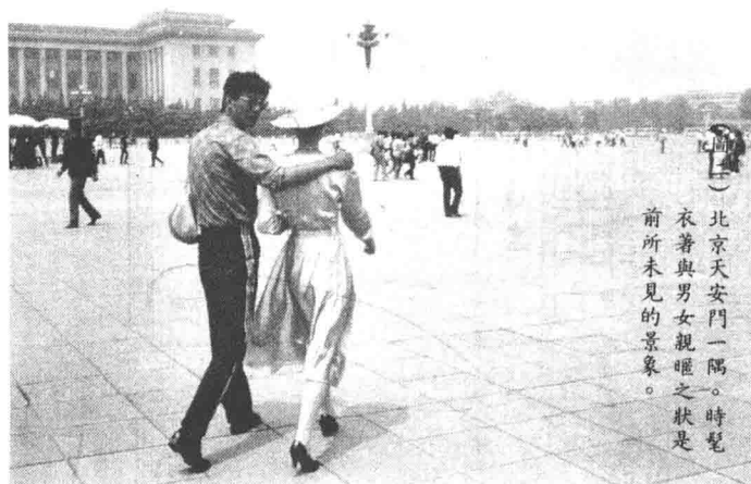
(圖二) 北京天安門一隅。時髦 衣著與男女親暱之狀是 前所未見的景象。