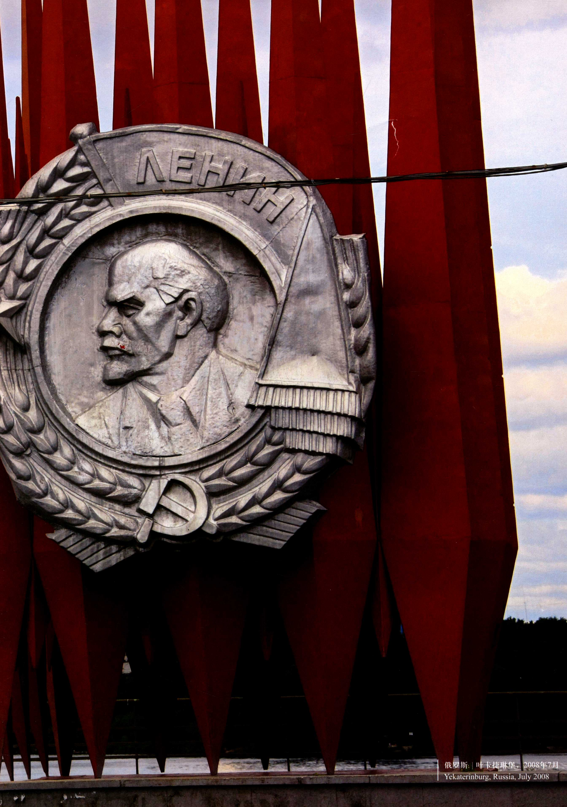
俄罗斯 | 叶卡捷琳堡, 2008年7月 Yekaterinburg, Russia, July 2008