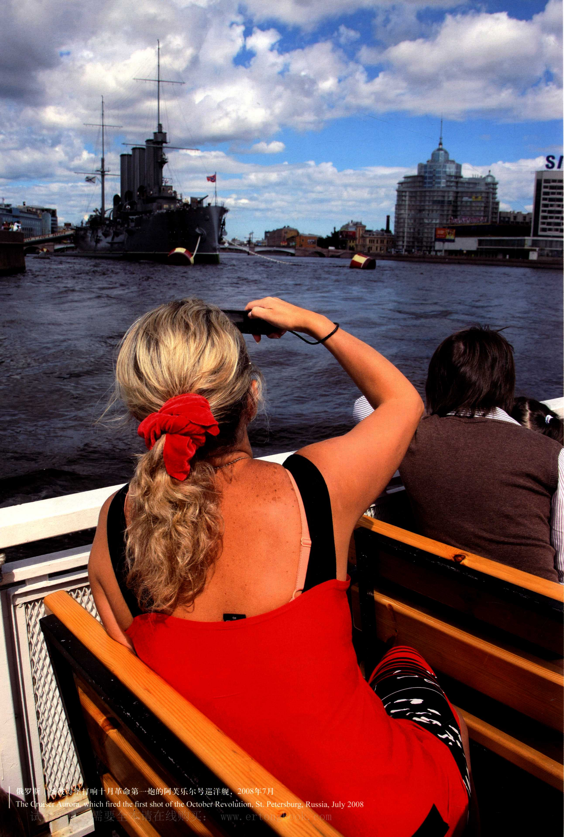
俄罗斯 圣彼得堡打响十月革命第一炮的阿芙乐尔号巡洋舰，2008年7月