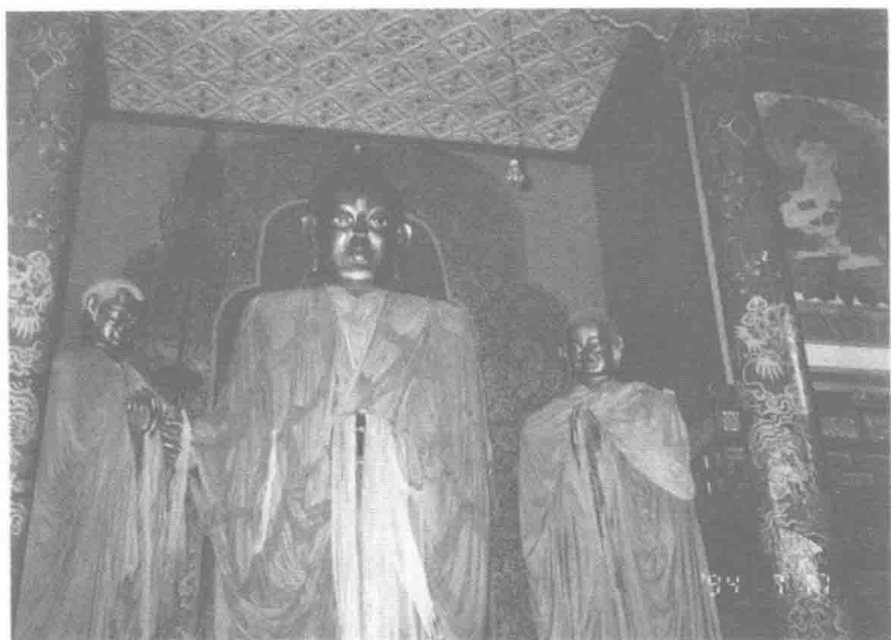
▲康定跑馬山釋尊像。