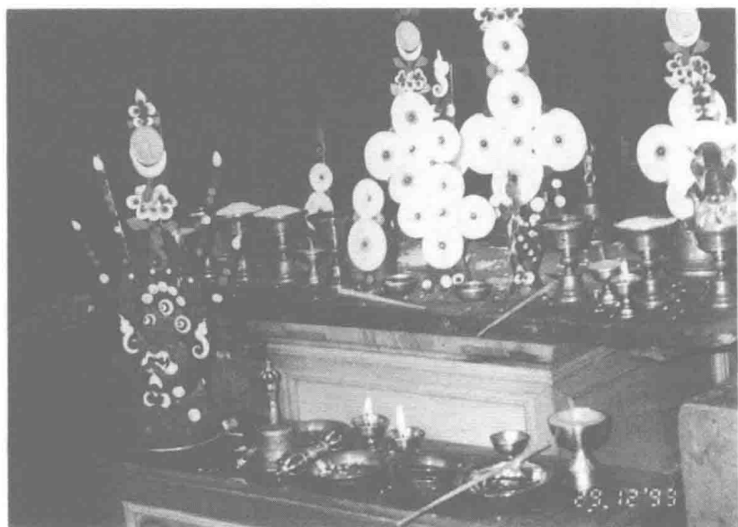
▼吉祥天母灌頂多瑪。