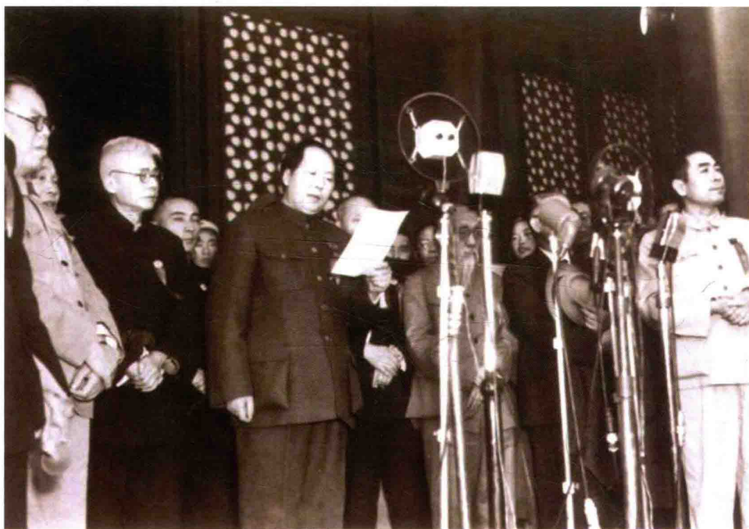
毛泽东宣布中央人民政府成立