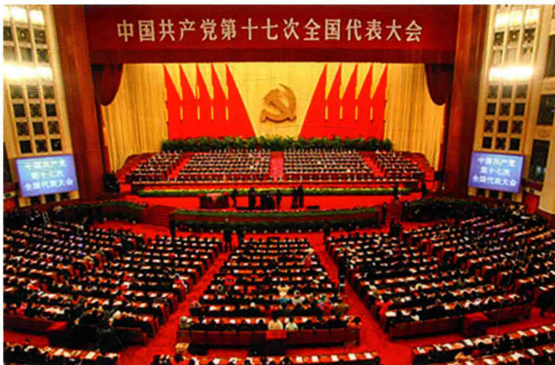
中国共产党第十七次全国代表大会政治报告中提出全面落实依法治国基本方略,加快建设社会主义法治国家