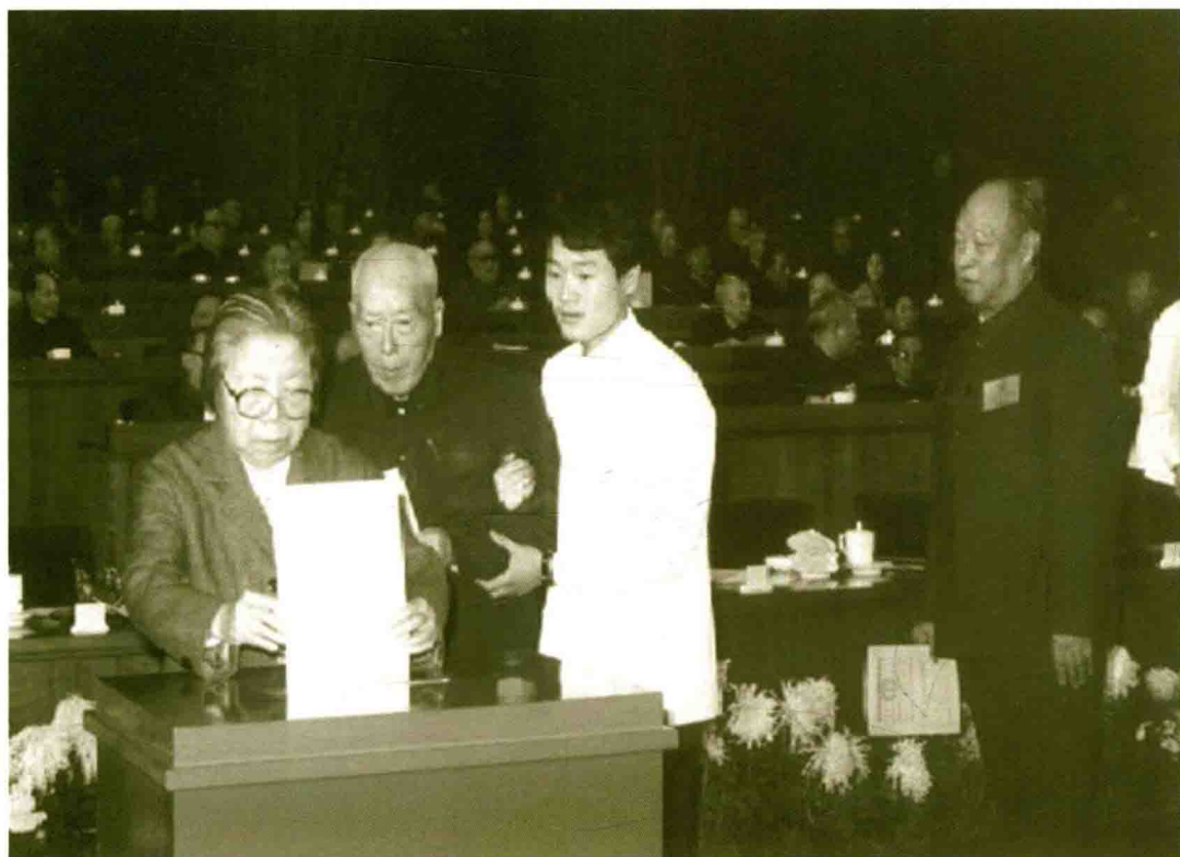
五届全国人大五次会议以无记名投票方式对宪法修改草案进行表决