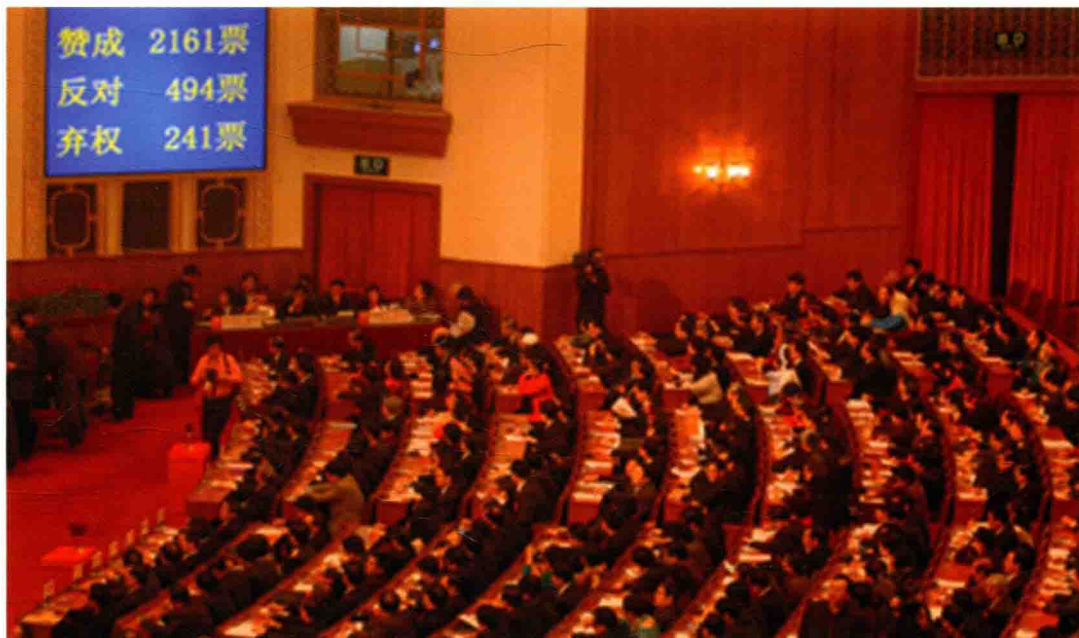
第十届全国人大第二次会议通过宪法修正案,将尊重和保障人权写入宪法