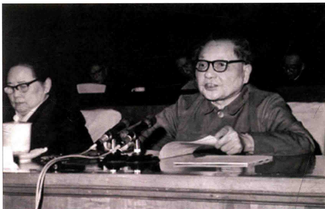
邓小平强调保障人民民主,健全社会主义法制