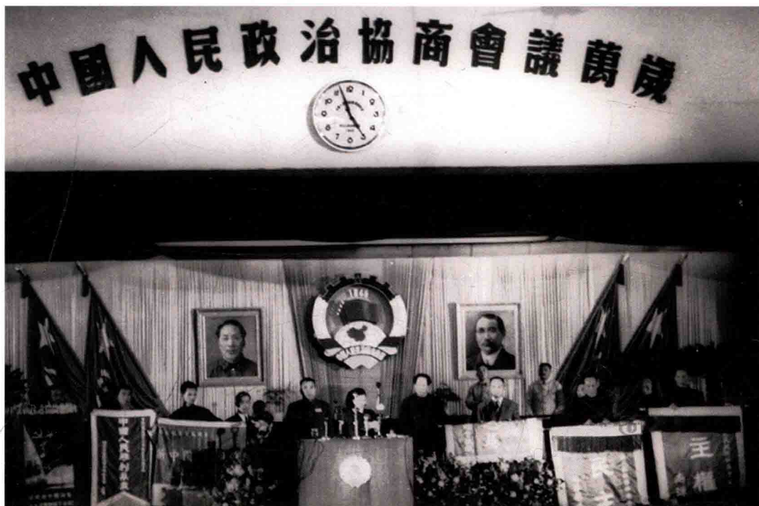
中国人民政治协商会议第一届全体会议通过《共同纲领》