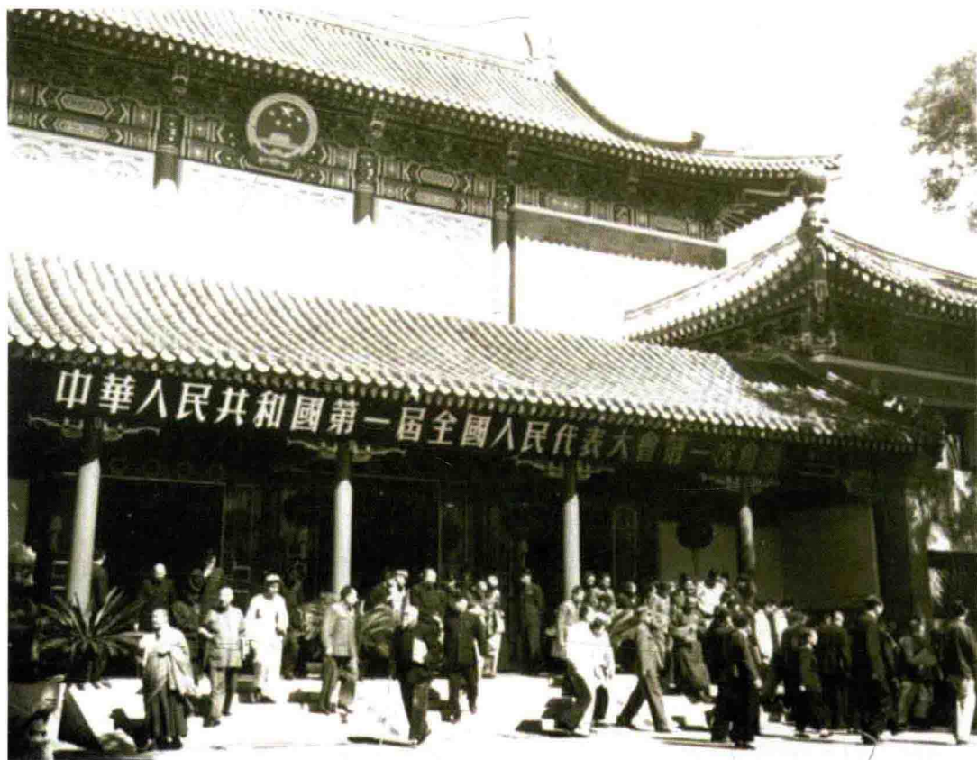
一届全国人大一次会议隆重开幕