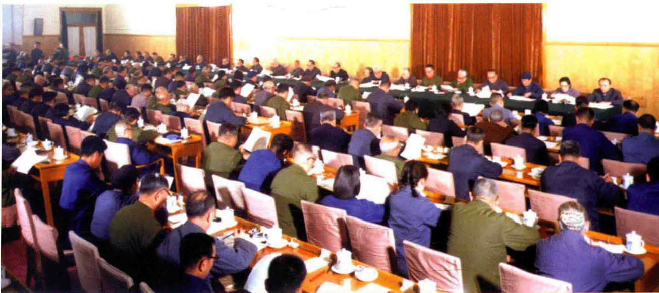
党的十一届三中全会