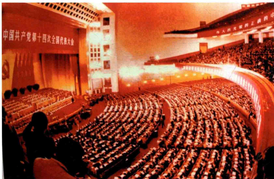
中国共产党第十四次全国代表大会提出加强立法工作,严格执行宪法和法律