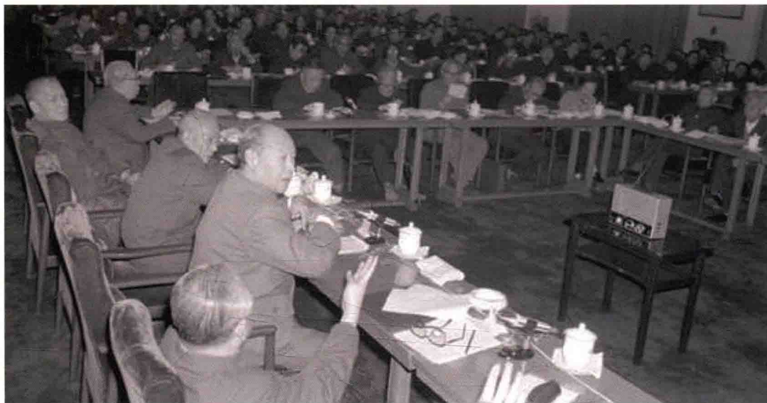
第六届全国人大第四次会议通过《民法通则》