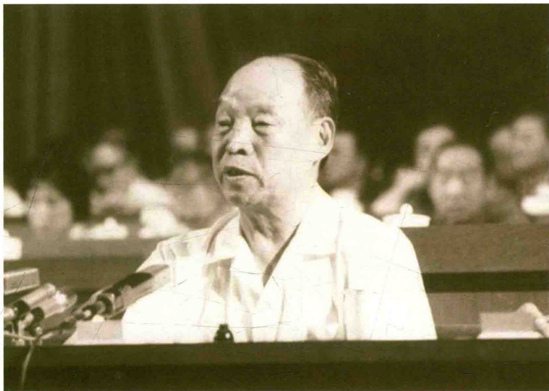
彭真作关于七个法律草案的说明