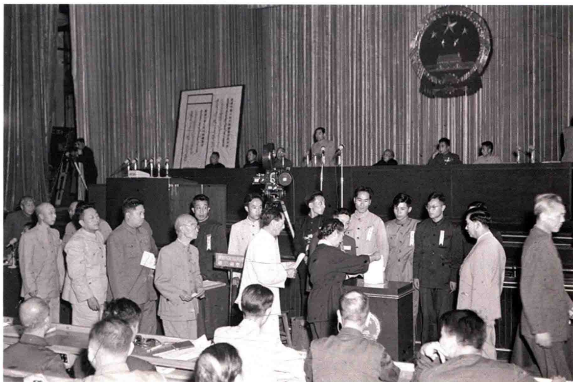
第一届全国人民代表大会第一次会议代表投票通过《中华人民共和国宪法》