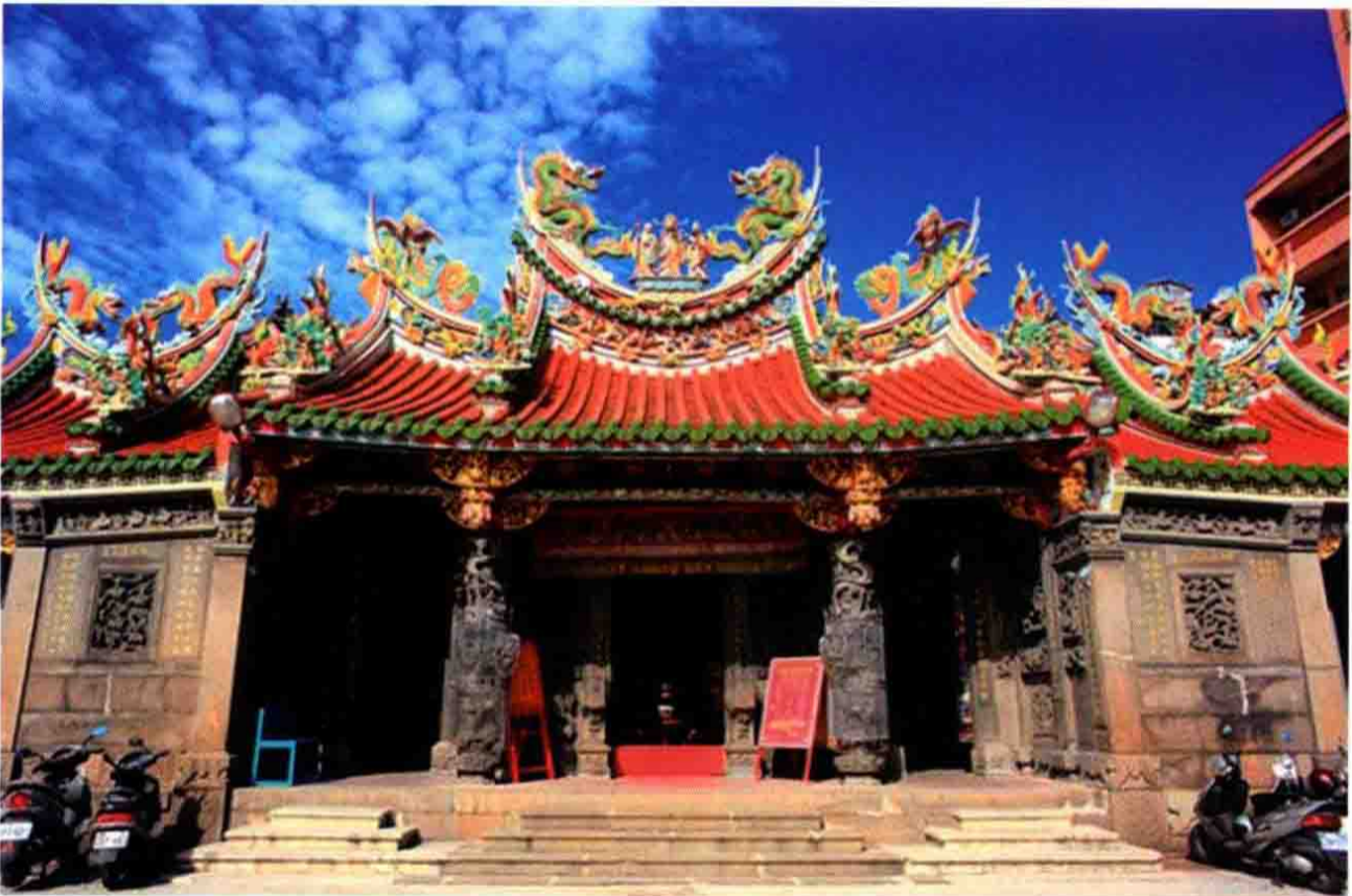
新北市淡水祖师庙