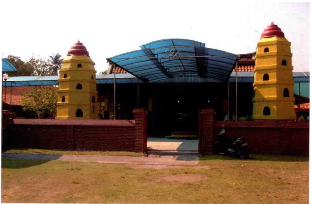
印尼丹絨加赫祖師廟