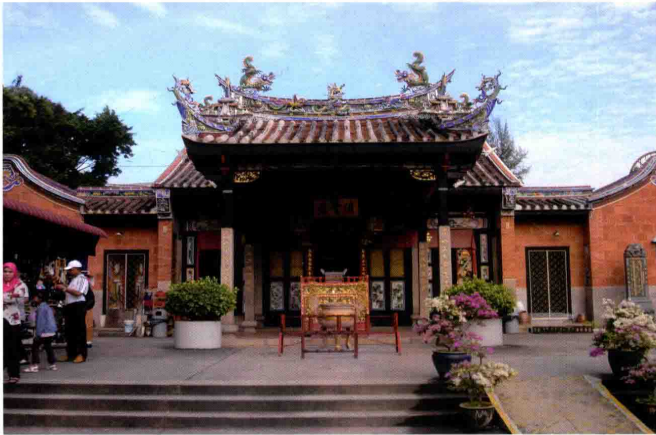
马来西亚檳城清云岩（蛇庙）