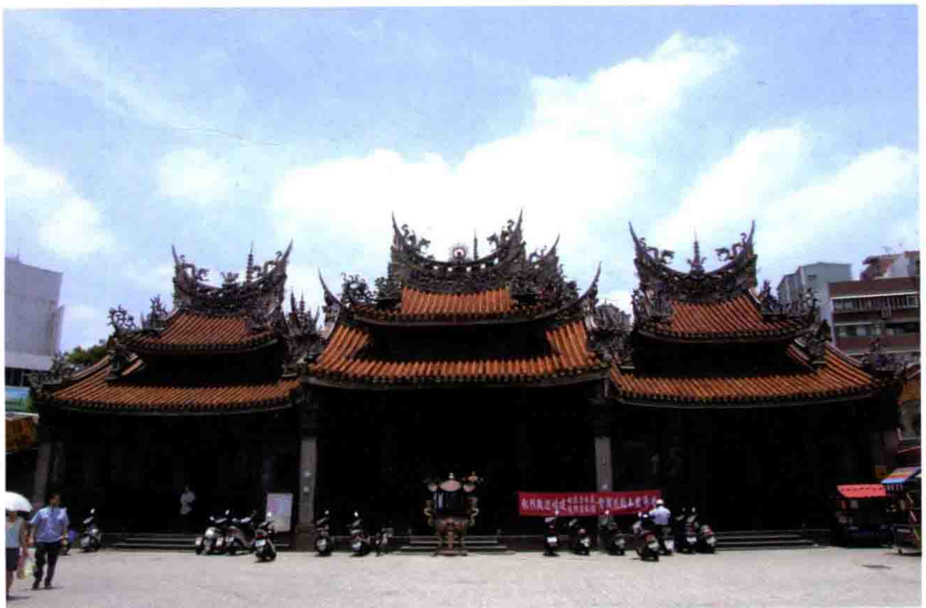
新北市三峡长福岩