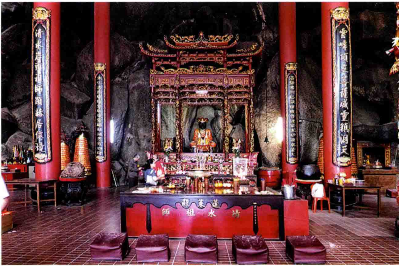
马来西亚云顶清水岩祖师殿