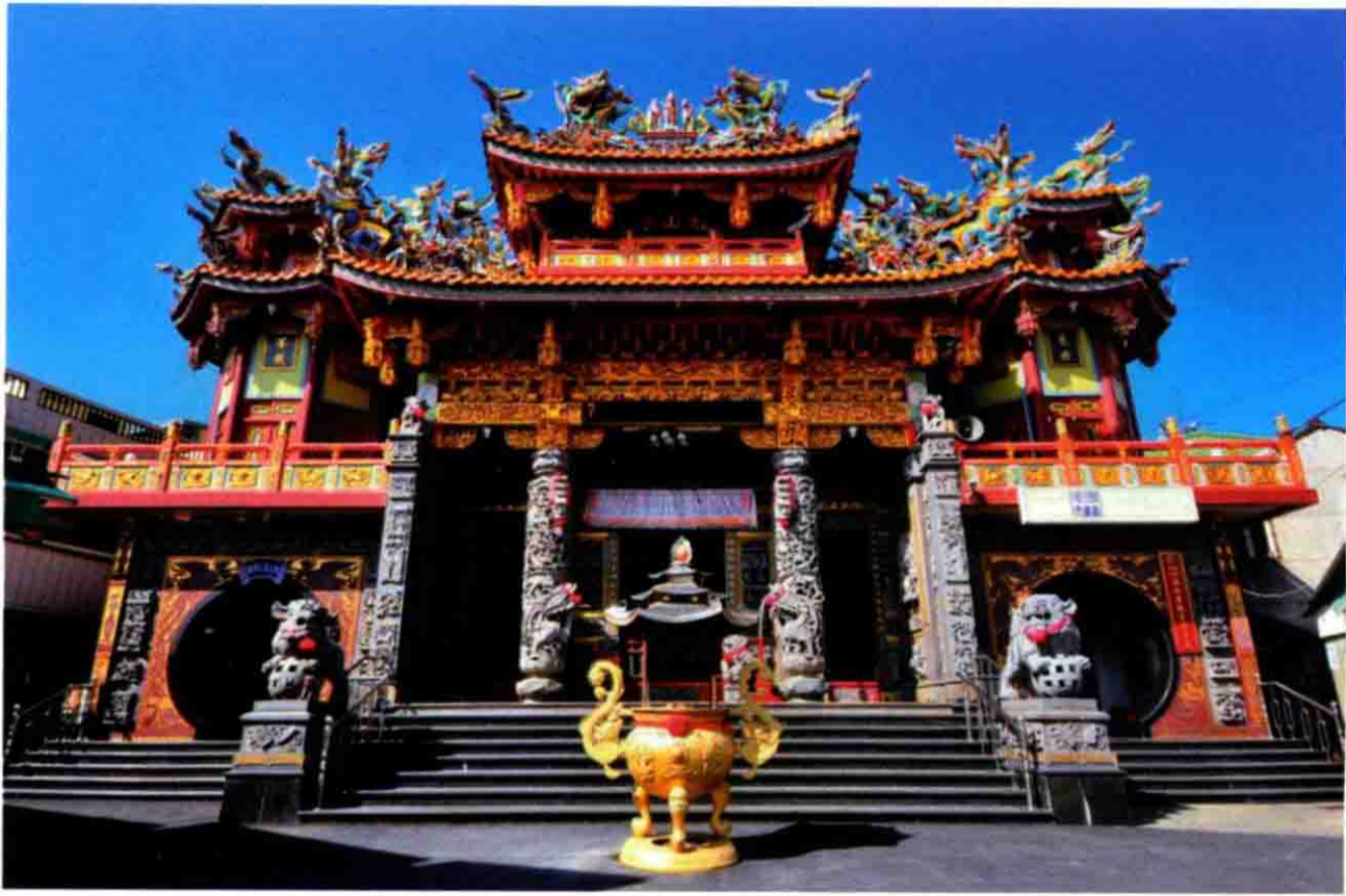
台南四鯤鯓龙山寺