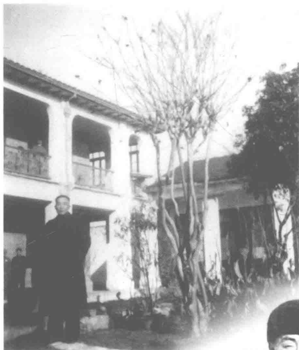
1950年12月23日， 摄于绍兴地政局院内