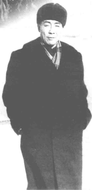
1951年访问苏联时留影