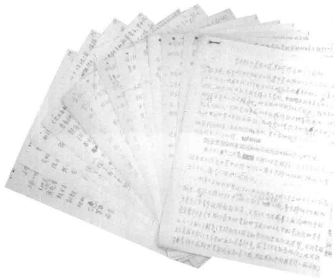
部分外调材料手稿