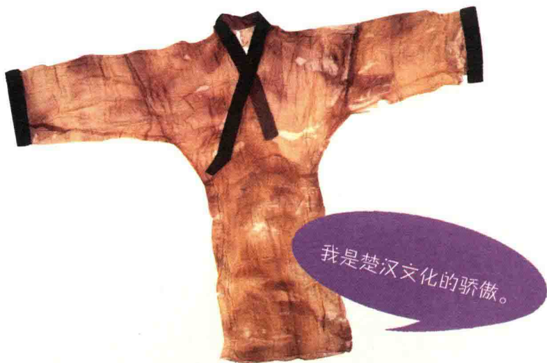
图 1.1.2 素纱禅衣 湖南省博物馆馆藏

纱,是我国古代丝绸中出现最早的一种,它的组织结构比较简单,是一种方孔平纹织物。因为是单经单纬交织而成,所以孔眼就充满了织物的表面,空隙所占面积特别多,因而显得非常薄。用“薄如蝉翼、轻若烟雾”来形容它,一点儿也不为过。