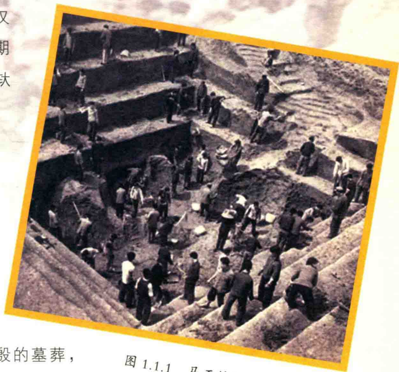
图 1.1.1 马王堆汉墓挖掘现场

马王堆汉墓是西汉初期长沙国丞相轅侯利苍及其家属的墓葬。为什么取名“马王堆”呢?原来,该墓葬曾被讹传为五代