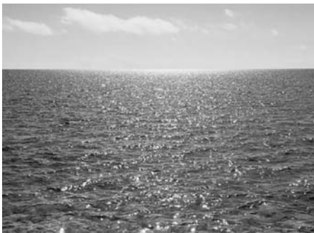
从规模上来看，原始海洋的面积远没有现代海洋这么大。

从规模上来看，原始海洋的面积比现代海洋小很多。据估算，它的水量只有现代海洋的 10% 左右。后来，因为贮藏在地球内部的结构水的加入，原始海洋才逐渐壮大，形成了蔚为壮观的现代海洋。原始海洋中的水不像现代海水一样又苦又咸。现代海洋海水中的无机盐，主要是通过自然界周而复始的水循环，由陆地带入海洋而逐年增加的。可是，原始海洋中的有机大分子十分丰富，是现代海洋所无法企及的。