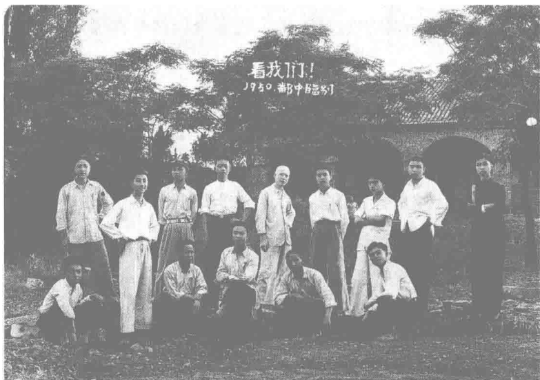
▲ 1950年中学毕业时摄于学校门口，后排右三为作者。“江南三月花似锦，小城夜半米酒甜”，中学时代的情景至老难忘。

在中学读书时，语文老师偏爱我，可数学老师对我头痛。数学能及格就是伟大胜利。我最喜爱的是文学，最美的梦是当作家。在昏暗的豆油灯下读唐诗宋词，是我最大的乐趣。