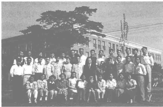
▲ 1956年人民大学哲学研究班合影，二排右四为作者。“两棵松树如盖，三层灰楼新建”，与现今校园无法相比。人民大学老人对原来两棵如盖松树仍怀思念。

这个转轨并不困难。马克思主义哲学原理和马克思主义哲学史本来就是不可分的。马克思主义哲学史，无非是马克思主义哲学原理创立、发展的过程，离开了马克思主义哲学原理，也就没有马克思主义哲学史。反过来说，马克思主义哲学原理，无非是马克思主义发展史的结晶。如果马克思主义哲学原理没有自己的历史，没有经历创立、发展、成熟的过程，也不可能科学的马克思主义哲学原理的出现。其实，马克思主义哲学史就是马克思主义哲学原理，不过是以历史形态出现的原理，即处于形成过程中的原理；而马克思主义哲学的每一个范畴和原理，都不是一次完成的，都包含着自己的历史。在我自己对马克思主义哲学史的研究中，我深感熟知马克思主义哲学原理的重要性。如果不是在此之前，对马克思主义哲学原理和经典著作稍微用过一点儿力，连眼前这一点小小的成绩都很难达到。