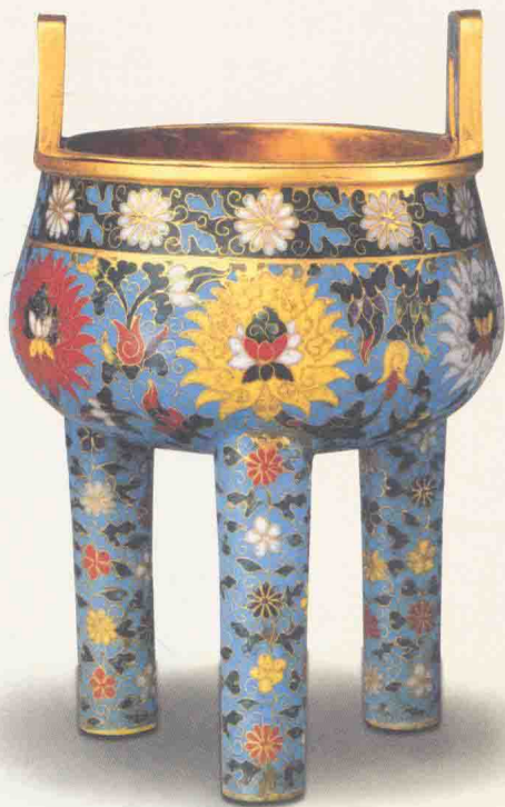
◎ 元代缠枝莲纹鼎式炉

现在人们习惯将铜胎掐丝珐琅称作“景泰蓝”，景泰蓝是中国传统手工艺之一，属于金属与珐琅工艺的复合工艺品。景泰蓝在中国数千年的工艺美术发展史上，以其庄重典雅的醇厚造型，精湛烦琐的纹饰技巧，金碧辉煌的炫丽色泽，流光溢彩的艺术气韵以及独树一帜的地域风格，成为世界文化宝库中的艺术珍品。