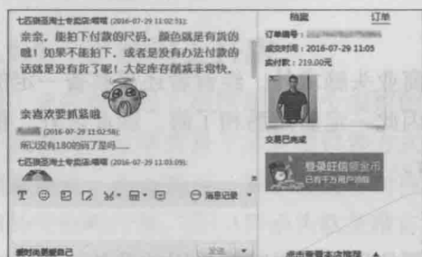
▲ 图1-2 聊天软件