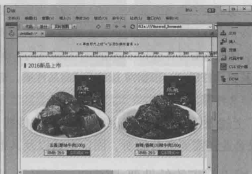
▲ 图1-5 Dreamweaver界面