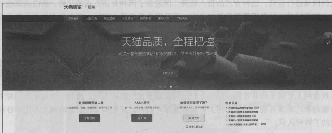
▲ 图1-6 入驻天猫商城的页面

自助式开店的优势是可以借助这些网上商店平台的人气，是一种非常主流的开店方式，图1-6所示为入驻天猫商城的页面。