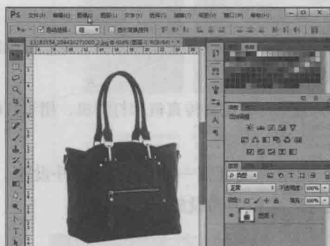
▲ 图1-4 Photoshop界面