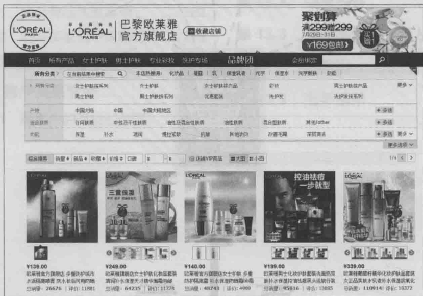
▲ 图1-1 欧莱雅官方旗舰店的商品页面

网上开店指通过互联网建立一个虚拟的商店，并通过该商店出售商品的销售方式。它是一种基于互联网大发展背景下的新型销售方式。在网上店铺中，购买者无法直接接触商品，只能通过商家图片、商品描述、买家评论等对商品进行了解。确认购买后，再由商家通过邮寄等方式将商品寄给购买者。图1-1所示为欧莱雅官方旗舰店的商品页面。