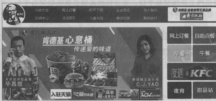
▲ 图1-7 独立网站

独立网站的经营推广比自助式网站更加困难，最好要有一定的运作团队来维护网站的运作。同时由于这类网站不挂靠其他商城，虽然不需要缴纳保证金，但网站推广维护的费用成本会更高，新的独立网站比较难以取得消费者的信任。