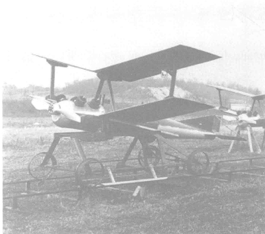
图 1.1 凯特林航空鱼雷

第一次世界大战初期,凯特林(“昆虫”)航空鱼雷(图 1.1)研制成功,它从铁轨上进行发射,飞越敌方领土,并冲入敌人的防线。这种鱼雷携带 180 磅(1 磅 \approx 0.45 kg) 烈性炸药,在撞击地面时被引爆。凯特林航空鱼雷的飞行轨迹是开环控制的,由发射方向决定,并且受航路上气流的影响。在航空鱼雷的飞行过程中,通过对螺旋桨的转数进行计数来估计其飞行距离,在预先计算好的位置停止发动机并丢弃机翼,从而实现武器的自动投放。