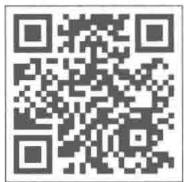
例 1—2 小方的“热情”