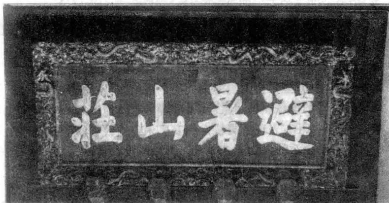
康熙御题“避暑山庄”匾额

此诗写于乾隆 39 年，当时他已经 64 岁。这年夏季，他在门前观看射箭比赛，触景生情，又想起了当年 12 岁时在此射箭比赛，曾经以连中 5 矢的成绩博得康熙赞赏，赏赐黄马褂一件。后来，因臂病发作，不能再行步射，只是马上骑射未停止。现在看着别人比赛射箭，怎么不让人技痒难耐？怎么不因自己心有余而力不足感到惭愧？遥想 26 年前，在北京大西门楼前曾取得 20 矢中 19 的好成绩，第二年又 10 矢 9 中，但现在想起来，自己都有些怀疑，何况没有亲眼见到过的人呢？