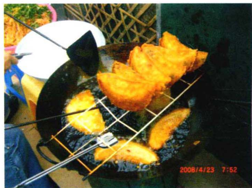
↑ 月儿粿 (瓢儿粿)