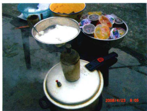
→ 甑蒸糕 (挺挺糕)