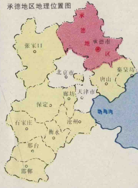
承德地区地理位置图