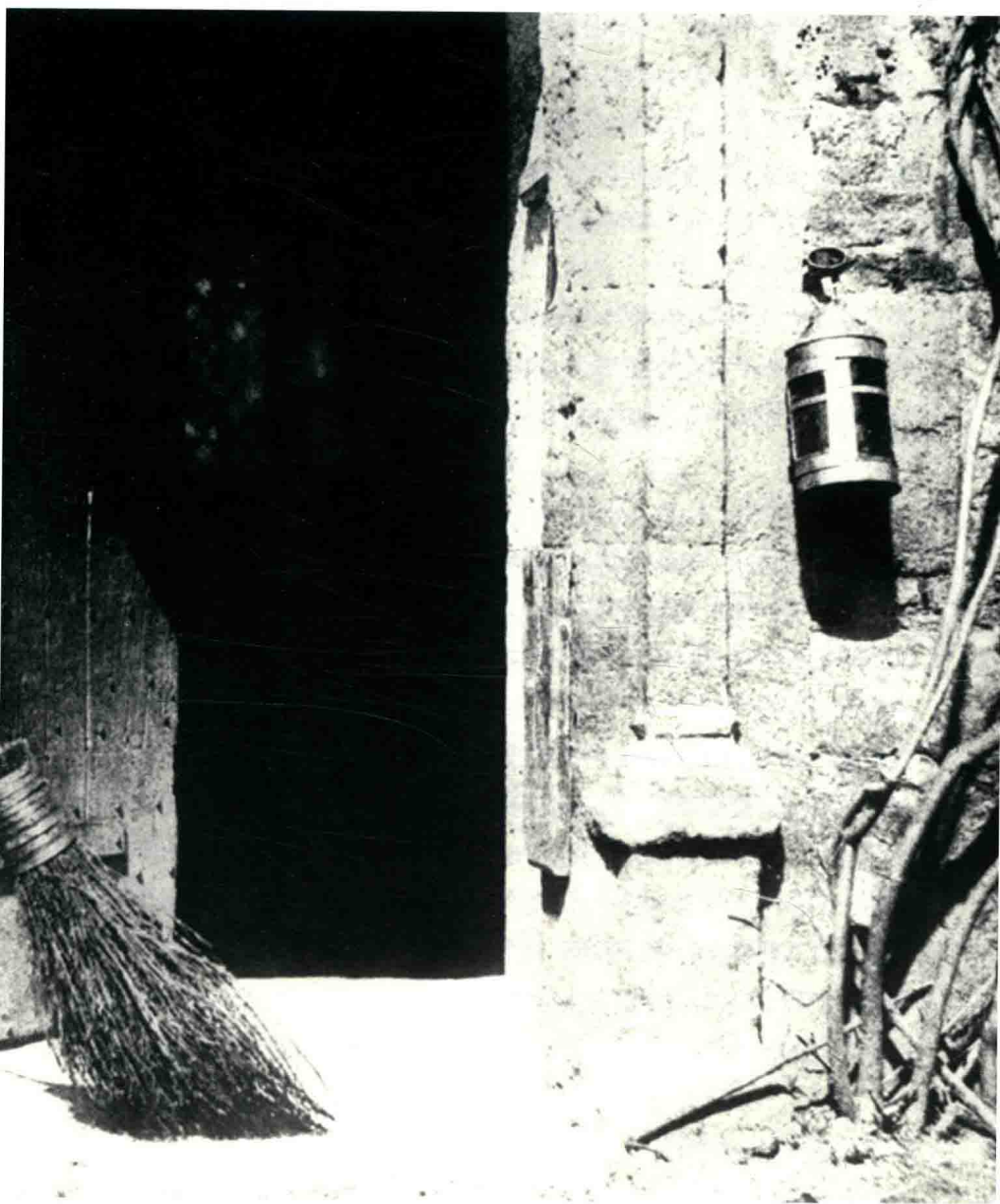
图1 《敞开的门》 福克斯·塔尔博特 1843