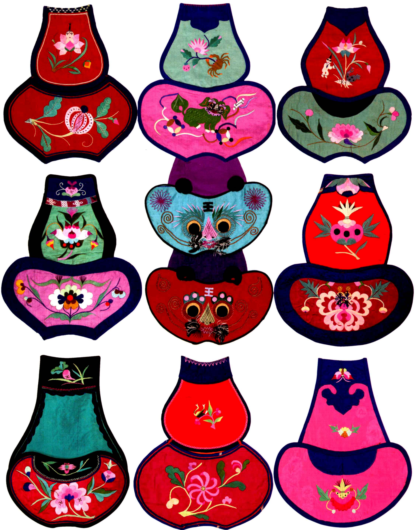
十式平针绣葫芦形肚兜