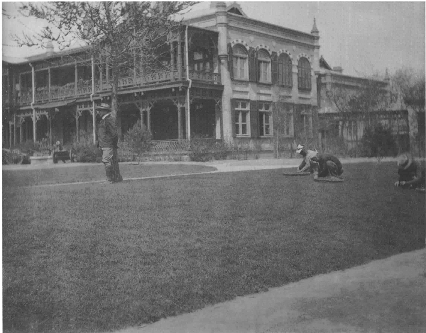
德国驻华公使馆的草坪 > The lawn in front of the Embassy of Germany in China