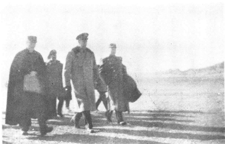
右起：周恩来、马歇尔(美)、张治中三人调停小组1946年到张家口机场