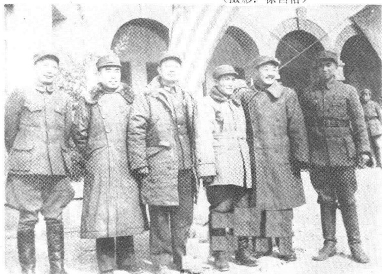
左起：聂荣臻、周恩来、叶剑英、蔡树藩、 贺龙和肖克同志在张家口机场