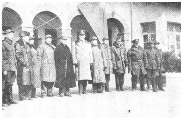
左起：第二人聂荣臻、第五人贺龙、第六人张治中、第七人马歇尔、第八人周恩来、第九人叶剑英在张家口机场