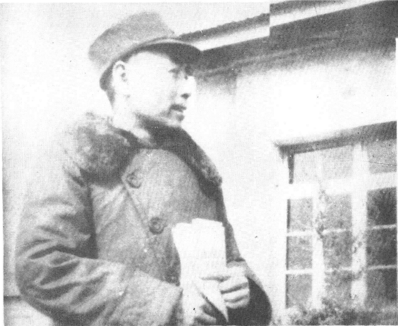
周恩来同志1946年在张家口机场