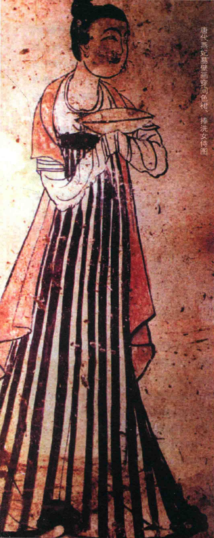
唐代燕妃墓壁画穿间色裙、捧洗女侍图

物部下·裙第十》引《晋东宫旧事》说：“皇太子纳妃，有绛纱复裙、绛碧结绫复裙、丹碧纱纹双裙、紫碧纱文双裙、紫碧纱文绣纓双裙、紫碧纱双裙、丹碧杯文罗裙。”两晋十六国时期，在广大妇女中流行起一种名为“间色裙”的裙子，以两种以上颜色的布条间隔而成，整条裙子在制作时被剖成数道，几色相间，交映成趣。开始时间色的布的色彩搭配有红绿、红黄等；后来，整条裙子被剖的愈来愈多，间色的布幅也相应地变得愈来愈窄，颜色也就愈来愈丰富。甘肃酒泉丁家闸北凉墓壁画上的女子，就穿着这种样式的裙子。