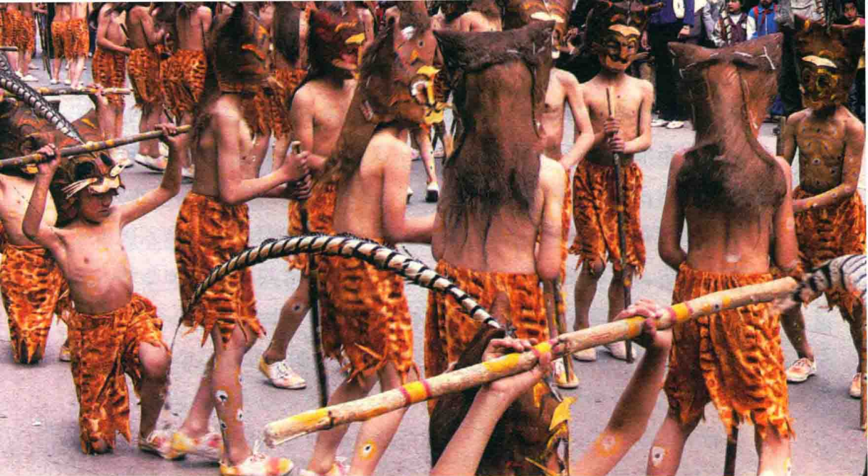
彝族祭祀舞蹈，跳蒙面赤身裸体画身的豹子舞穿的就是兽皮裙。

日子，围捕野兽与打鱼捞虾。某个炎热的夏天，某个女性先民拣取树叶串在一起作为裙子披在身上遮掩阳光，以避免皮肤受到烈日晒伤，同时她的羞耻感使她用树叶裙子遮住了她的敏感部位，她的这一新颖举动引起周围人的注目，人们好奇地围着她欣赏她的这件树叶裙子，渐渐地，纷纷效仿，都穿起树叶裙子。人类祖先从穿树叶裙子的那一天开始，就有了衣服。某个寒冷的冬天，某个冷得直打哆嗦的男性先民看到树上挂着一块晒干的兽皮，他取下兽皮披在身上用来遮体御寒，当他身披兽皮裙子向人群走来时，立即引起人们的震动，他的这件兽皮裙子也引起了人们的竞相效仿，于是，穿兽皮裙子成为流行时尚。神农氏是一个对中华民族颇多贡献的传奇人物，当年他就是身着兽皮裙子、肩披树叶穿行在茫茫大森林之中。显而易见，这个女性先民和这个男性先民发明的树叶裙子和兽皮裙子就是人类最早的时尚服饰，开启了人类服饰时尚的先河，她和他也是当时引领服饰时尚潮流的时尚人物。