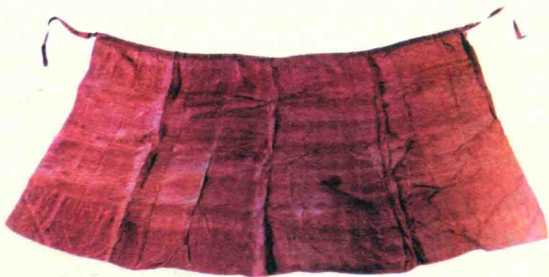
湖南长沙马王堆1号汉墓出土的西汉绛紫绢裙。

条裙。”古时将绢称做纨素,所谓“纨素三条裙”,指的是绢做的裙子。这些都是汉代女子穿裙的例证。形象资料中也有反映,如河南密县打虎亭汉墓出土的壁画上,就绘有许多穿裙的女子。在湖南长沙马