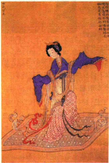
明代佚名《千秋绝艳图》中赵飞燕。

文献中最早记载裙子的出现要首推《西京杂记》和《飞燕外传》中赵飞燕的故事。汉成帝的皇后赵飞燕身轻如燕,十分喜爱穿裙子。有一次,赵飞燕穿着南越进贡的云英紫裙,与汉成帝游太液池。在广榭之上,赵飞燕为汉成