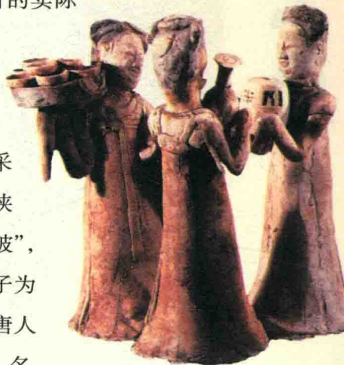
隋代彩绘仆侍陶俑群，梳平云髻，小袖衫，高胸背带裙，河南博物院藏。