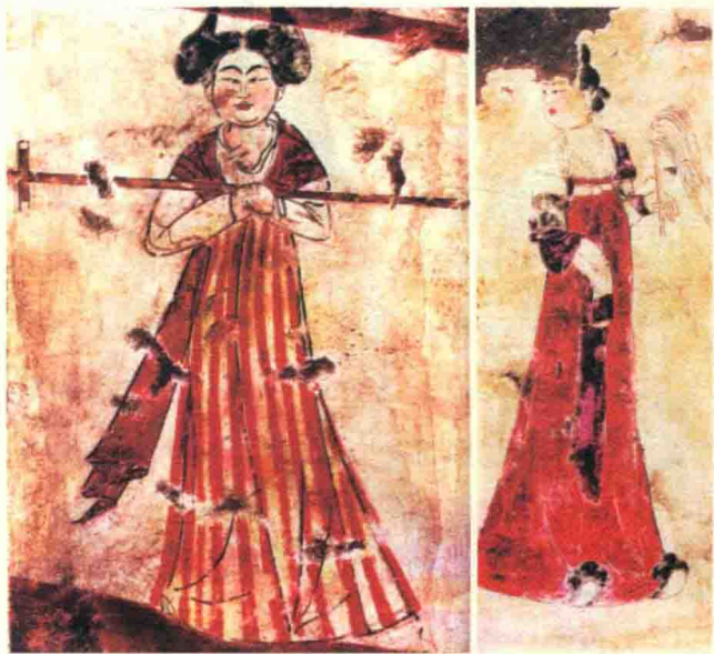
左：唐代李震墓壁画穿红裙、持杖女侍图。右：唐代李震墓壁画穿石榴裙、执拂尘女侍图。

唐代裙子色彩非常丰富，以红、紫、黄、青等为最流行，年轻女子最喜爱的是一种鲜艳的红裙。杜甫《琴台》：“野花留宝靥，蔓草见红裙。”《陪诸贵公子丈八沟携妓纳凉晚际遇雨》：“越女红裙湿，