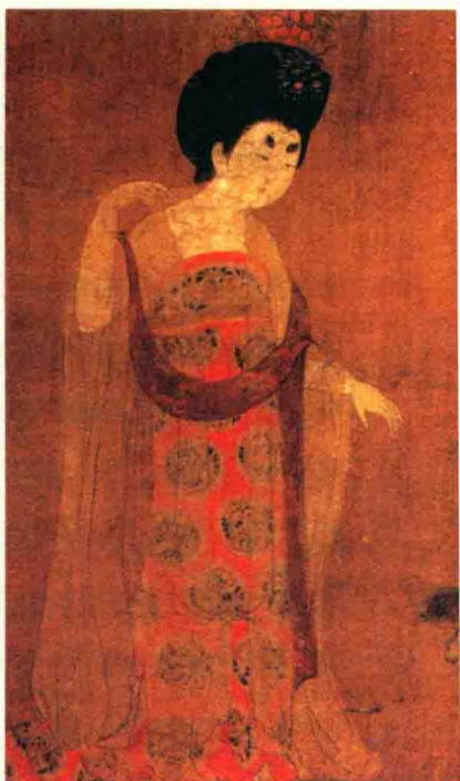
左：张萱《捣练图》仕女各个长裙曳地。右：唐代周昉《簪花仕女图（局部）》仕女着长裙。

代女子的裙子长度与前代相比有明显的增加，裙裾曳地在当时是常见的现象。为显示裙子的修长，女子着裙时袒露半胸，多将裙腰束在乳部，有时甚至束到腋下，以大带系结，大胆地夸张了女子的胸部，裙子的下摆则盖住脚面，有时在地下还拖曳一截。唐人诗文中多有描述，如王建《宫词》：“黛眉小妇研裙长。”王翰《观蛮童为伎作》：“长裙锦带还留客。”孟浩然《春情》：“坐时衣带萦纤草，行即裙裾扫落梅。”更把长裙的风姿描写地曼妙无比。从唐代绘画、壁画中也可以看到唐代女子穿长裙亭亭玉立的秀美形象，创作于不同时期的阎立本《步辇图》、《永泰公主墓壁画》、张萱《捣练图》、周昉《簪花仕女图》、《纨扇仕女图》等都绘有穿曳地长裙的女子形象，裙腰上提，高到掩胸的程度，故有诗云“慢束罗裙半露胸”，下摆长可曳地，因此“裙拖六幅湘江水”、“长裙锦带还留客”、“冶袖长裙兰麝香”……如果是贵妇，长裙曳地自然没什么困扰，而对于需要举止轻巧利落的侍女就会有种种不便，为不妨碍活动，她们穿着这种长裙劳作时，