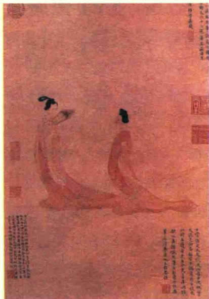
明代文徵明《湘君湘夫人图》中人物作唐妆，高髻长裙，有飘飘御风之态。