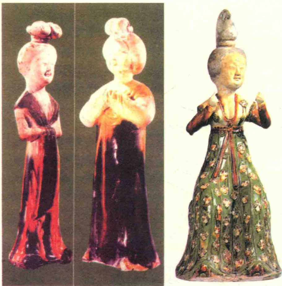
左：河南洛阳出土唐三彩侍女，可见唐初女子装束：襦裙、披帛。右：陕西西安王家坟出土的唐三彩女乐俑梳半翻髻，穿U字领半臂，内衫开胸，露出乳沟，下穿高腰十字瑞花条纹长裙。

红色裙子以石榴裙最为时尚，石榴裙以其石榴红的颜色命名，是一种偏暖色调的大红裙。红色最易引人注目，是一种热烈奔放的色彩，从色彩心理学上来说，红色能带出快乐激昂的情绪。唐人喜