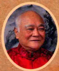
国医大师 李济仁 亲自主审