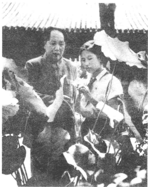
毛泽东和女儿李讷在观赏荷花(1953年9月)