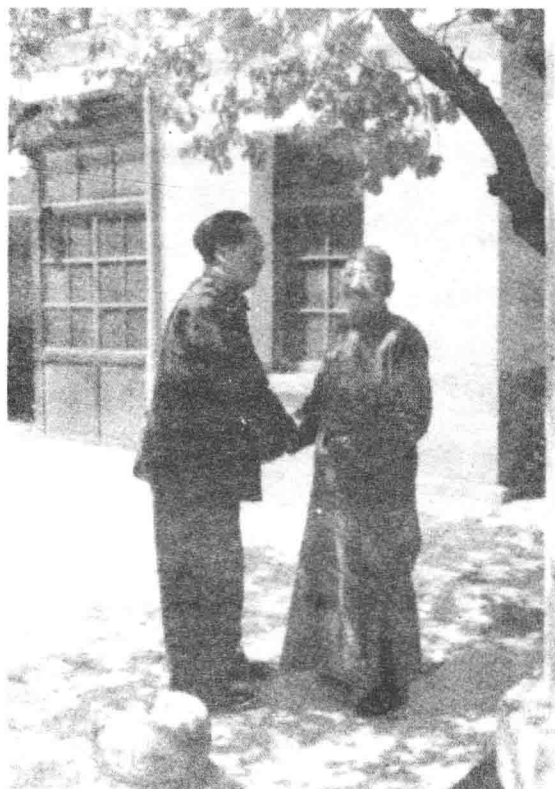
1949年同柳亚子先生在北京香山