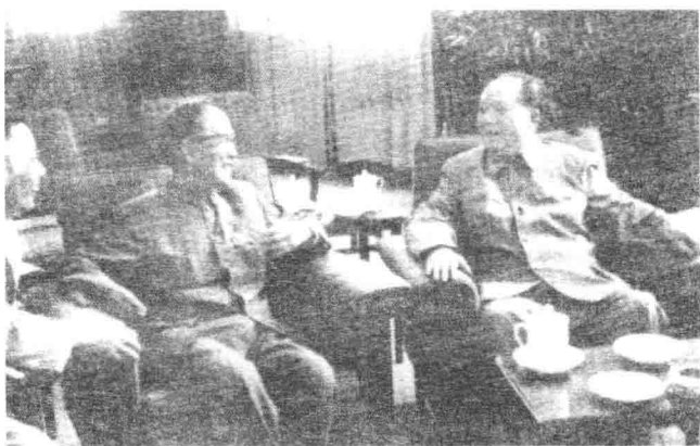
1964年2月13日,在春节座谈会上郭沫若同志亲切交谈