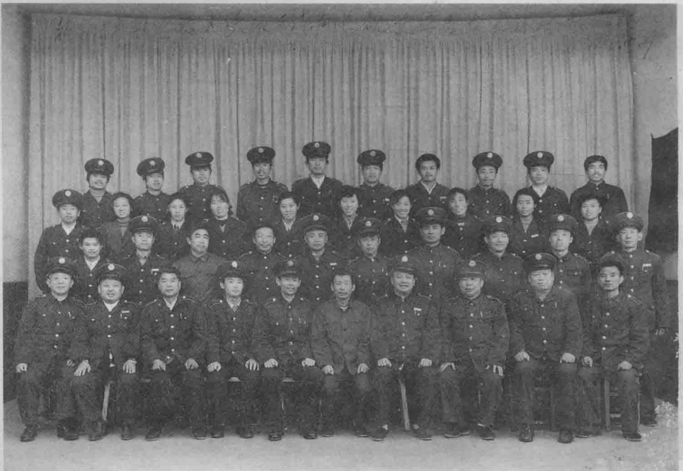
一九八六年十月二十九日部分机关干部及全体所长合影