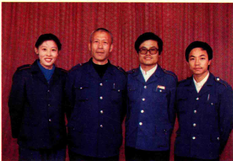
德州市税务志编写人员合影