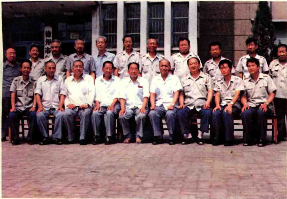
应邀参加《市税务志》编写座谈的老同志同局领导合影