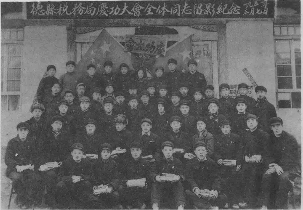
一九五一年三月七日德县税务局庆功大会全体同志合影