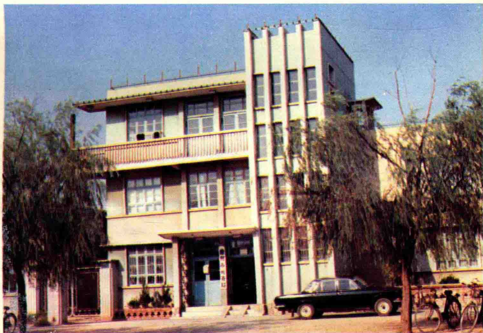
德州市税务局办公楼