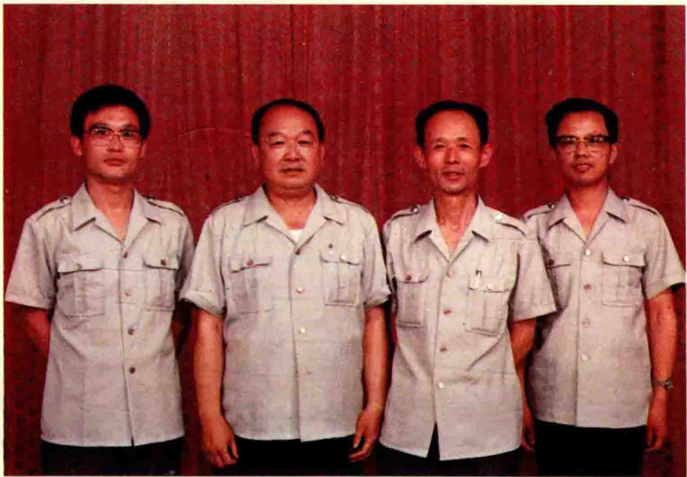
现任德州市税务局局长合影