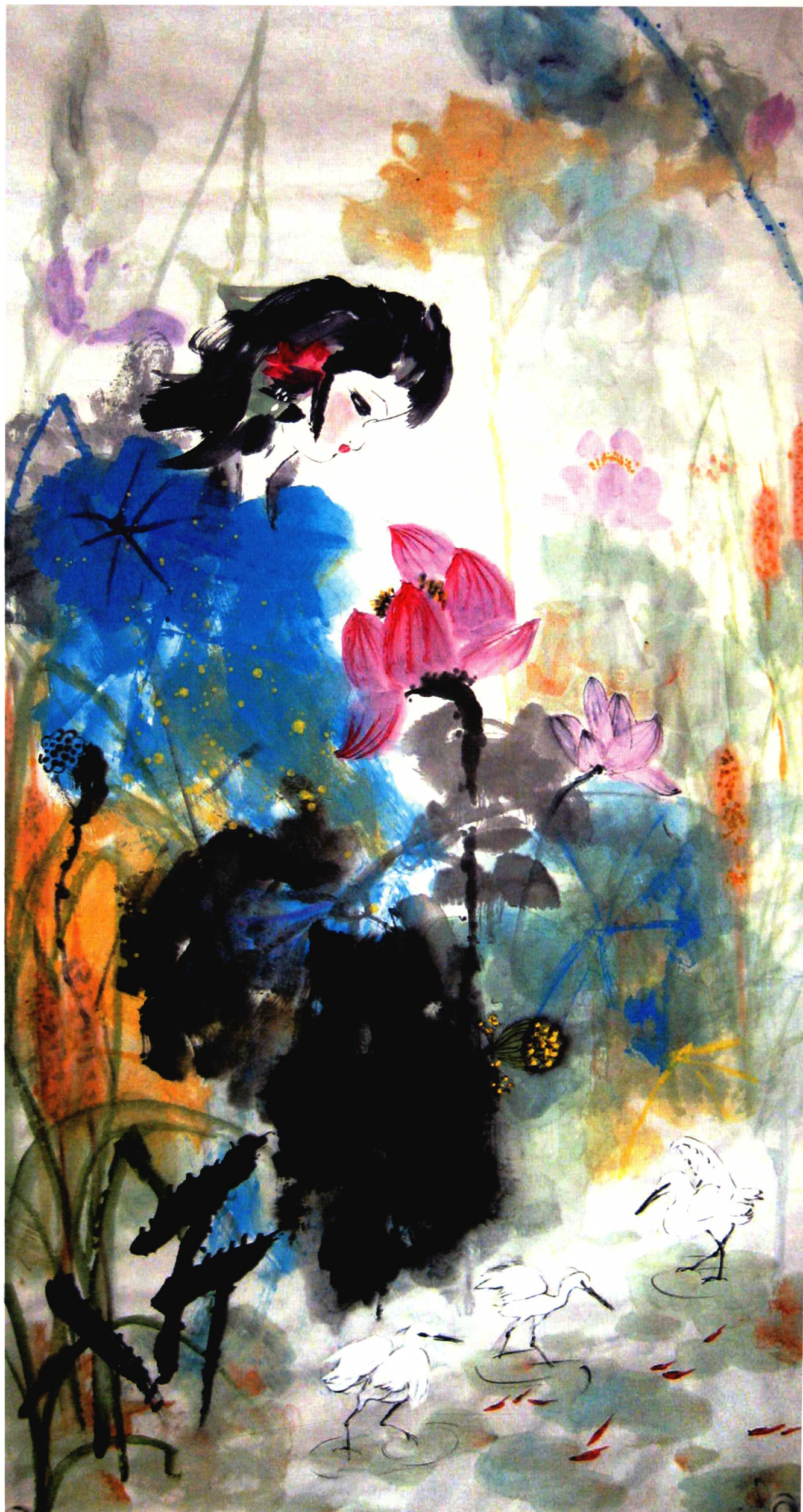
误入藕花深处 143cm X 73cm