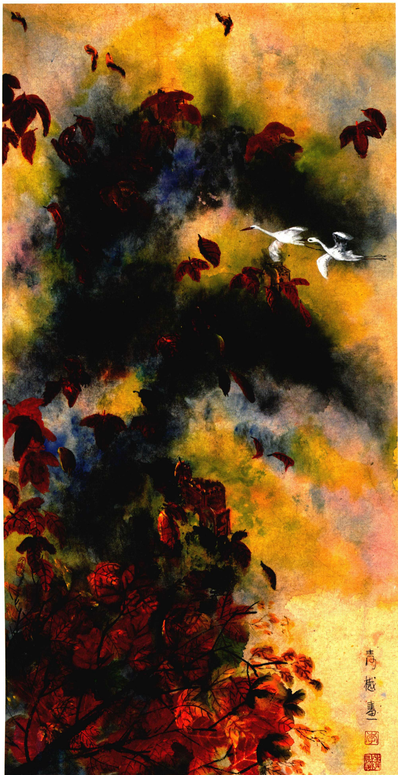
神州彩如虹 143cm X 73cm