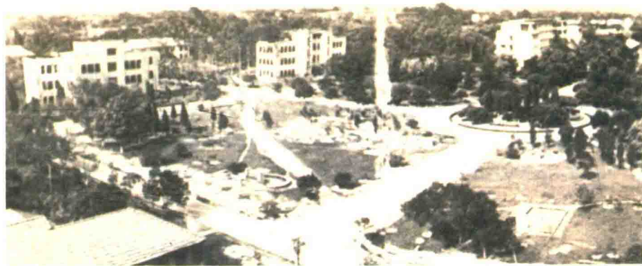
三十年前广西大学校园俯瞰

马君武出生于 1881 年，祖籍湖北。少年时在桂林接触维新思想，1902 年留日期间结识孙中山，1905 年参与组建同盟会，是同盟会章程的八位起草人之一。辛亥革命后，他参与起草《临时约法》，担任孙中山的秘书长，并在德国获工学博士学位。他曾任广西省长，也是广西大学的创校校长。马君武毕生投身现代高等教育，成绩卓然，与蔡元培有“北蔡南马”之并誉。1940 年，马君武因病逝世于广西大学校长任上。鞠躬尽瘁，死而后已。