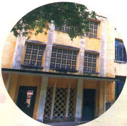
我们曾经住过的宿舍——六栋