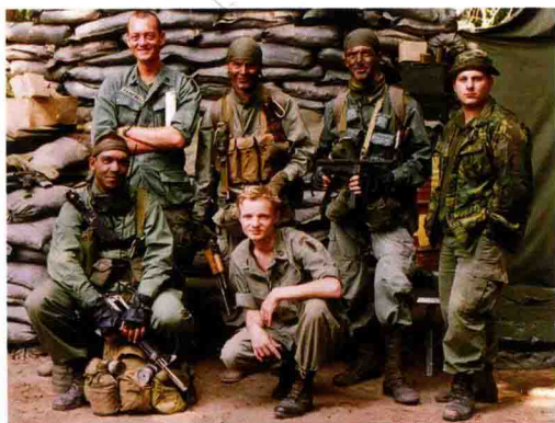
■ 早期的“三角洲”特种部队队员