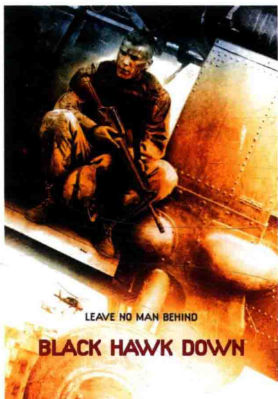
■ 电影《黑鹰坠落》海报

电影《黑鹰坠落》真实地反映了“三角洲”特种部队历史上最悲惨的一页，尽管这次行动以失败而告终，但“三角洲”特种部队的队员们过硬的作战能力和生死与共的战友之情，依然让观众敬佩不已。