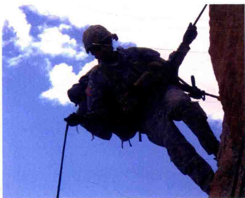
■ 进行山地攀爬训练的“三角洲”队员