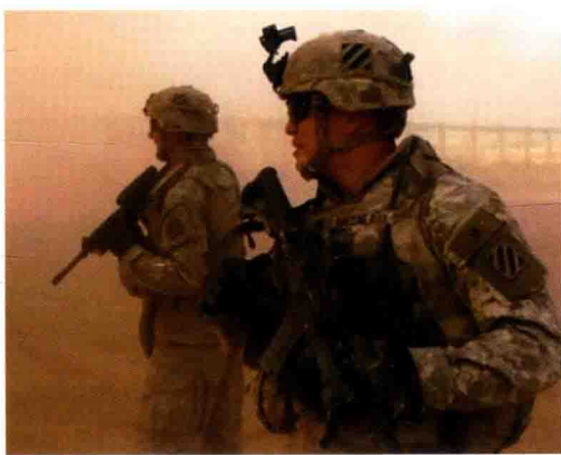
■ 在中东地区执行任务的“三角洲”队员