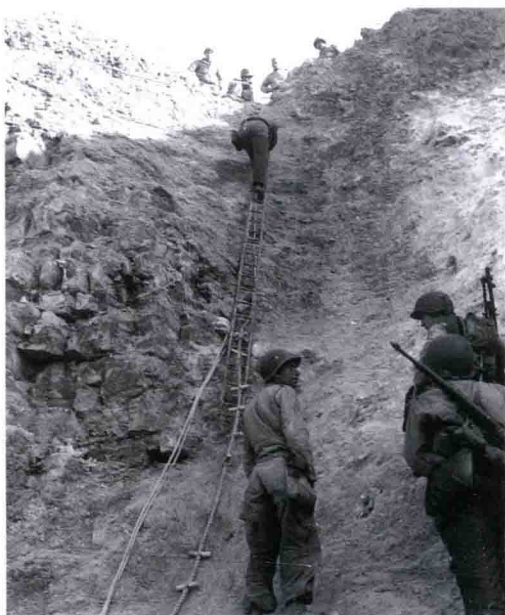
■ 二战时期进行训练的“游骑兵”特种部队