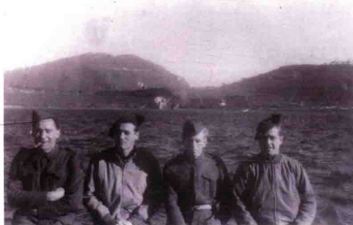
■ 早期的“游骑兵”队员

“游骑兵”可以说是美国军队的极具特色的名词，最早可以追溯至1670年美洲殖民地时期。当时，殖民者为了应付善于突袭战术的印第安人，于是组成小型的侦察骑兵队伍在屯垦区四周区域巡防，由于他们的巡防距离称为“Range”，因此这些士兵就被称为“Ranger”。第一支正规的“游骑兵”部队成立于1756年的新汉普郡，罗伯特·罗杰斯少校首先组织九连的“游骑兵”部队。