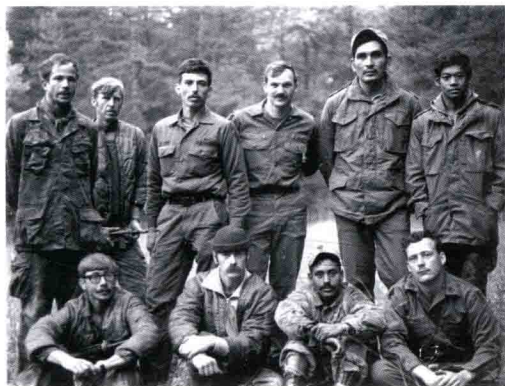
■ 成立初期的“三角洲”队员