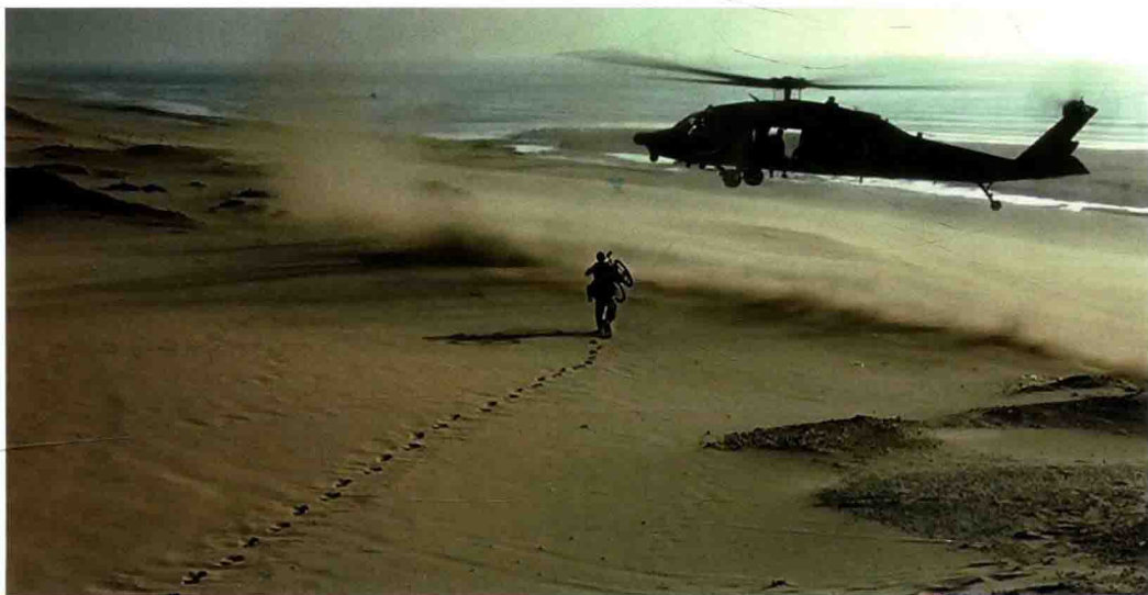
■ 电影《黑鹰坠落》剧照