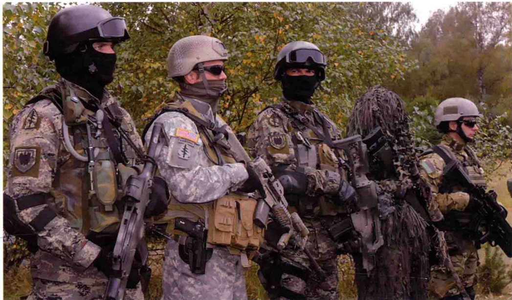
■ “三角洲”特种部队与其他特种部队共同执行任务

在体能上，队员必须要能够在25秒内后退爬行35米、每分钟仰卧起坐37次、每分钟做俯卧撑33个、24秒内通过所设置的障碍、16分钟内完成2千米长跑、能全副武装泅渡100米。完成这些项目后紧接着进行18千米急行军，休息2小时后，还必须在24小时内，在得不到任何暗示、指点的情况下，仅靠一个罗盘和一张地图，在荒无人烟的地区完成单独行军74千米的体力极限测试。