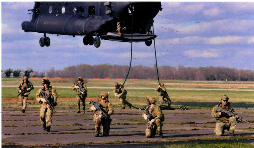
■ “游骑兵”特种部队队员进行直升机绳降

参选者首先在“游骑兵”训练旅罗杰斯营区完成报到程序，然后前往位于北卡罗来纳州森林中的达比营区接受甄选。甄选内容除了长跑测试体能以外，还有在恶劣环境下忍受饥寒等极端情况，无法接受者就会被淘汰。通过以上筛选，则进入“游骑兵”评估阶段，主要包括陆军体能训练测验、水中战斗与生存测验。在这些测验中如有遗失任何装具，或稍有畏惧或退缩的表现也会遭到淘汰。