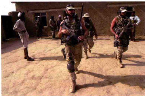
■ “三角洲”队员进行情报收集

特种部队在执行很多任务时，特种部队队员都需要从空中快速隐蔽地渗透到敌方的领地。目前美国特种兵的空降训练分别在位于布莱格堡和杰文斯堡的两个学校里进行。在这里特种兵会学习到两种跳伞方式：第一种是从8000米高空跳伞，降至300米时才打开降落伞的方式，俗称“高跳低开”（High Altitude Low Opening）；第二种是在同一高度（8000米）跳伞，使用翼伞在方圆10~12千米区域内降落。这两种跳伞方式与普通空军的跳伞方式有很大的不同，对特种队员的勇气和空降能力都有很高的要求。