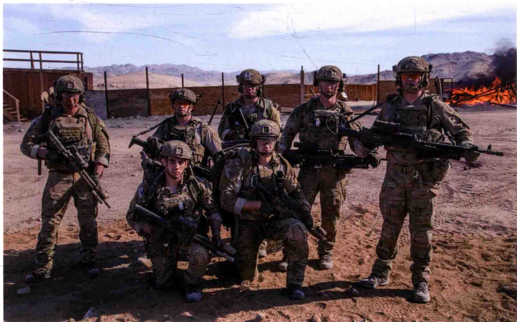
■ “游骑兵”特种部队小分队成员

1944年诺曼底登陆时，盟军的主力是美军第7与第5军团，“游骑兵”则隶属于第5军团。第5军团的主力是第29步兵师，右翼为第1步兵师，左翼则是由第2和第5游骑兵团组成的“临时游骑兵群”（Provisional Ranger Group）。登陆当日，美军遭遇德军第352步兵师的猛烈攻击，此时“游骑兵”不畏生死地迅速突破防线。虽然伤亡极为惨重，可是“游骑兵”的英勇善战让并肩作战的第29师步兵刮目相看。