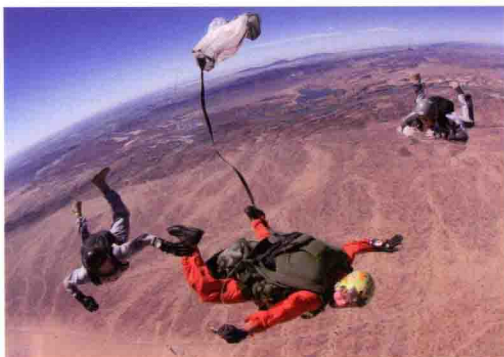
■ “三角洲”特种部队在进行高空跳伞训练

在短短的时间里，通过近似严酷的训练，“三角洲”部队已成为美国在世界各地进行反恐怖行动的一把尖刀。美国反恐怖办公室、中央情报局、联邦调查局、司法局等单位组成的一个联合考核委员会，曾对“三角洲”部队进行了一次模拟考试，结果令在场的人为之震惊。美联社的一位记者甚至幽默的评论说：“如果给这支部队一架长梯，他们能爬上月亮！”