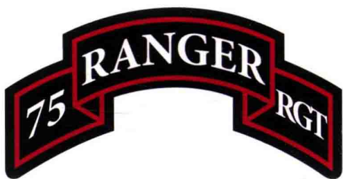
■ “游骑兵”特种部队臂章

飘带状臂章是“游骑兵”特种部队的突出标志，臂章上绣有“75 RANGER RGT”字样，即“75th Ranger Regiment”的简写。在美国陆军中，只要曾通过游骑兵学校训练课程，拥有“游骑兵”臂章的士兵，都可以被称为“游骑兵”。但只有服役于“游骑兵”特种部队编制单位的士兵，才会被认可是正统的“游骑兵”。