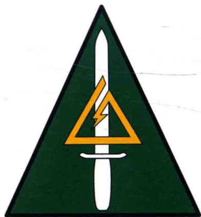
■ “三角洲”特种部队徽章

“三角洲”特种部队（Delta Force）是美国于20世纪70年代末组建的一支用来执行反恐作战任务的特种部队，也称“三角特遣队”。其全名为美国陆军第一特种部队D分遣队（1st Special Forces Operational Detachment-Delta, 1st SFOD-D）。在美军军方代号中，D用Delta代替，而Delta（Δ）也有“三角洲”的意思，故很多时候会用“三角洲”特种部队来称呼该部队。