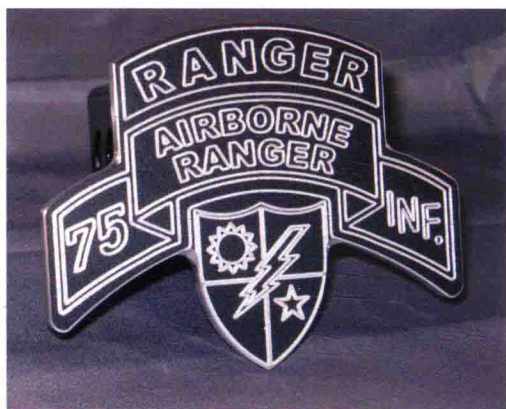
■ “游骑兵”特种部队的标志

“游骑兵”特种部队的总部位于佐治亚州本宁堡（Fort Benning）。本宁堡是美国陆军的训练基地，在佐治亚州马斯科吉郡哥伦布与查塔胡其郡，以及阿拉巴马州拉塞尔郡分别设有不同的训练中心。除了“游骑兵”特种部队，美国陆军装甲兵学校（United States Army Armor School）、美国陆军步兵学校（United States Army Infantry School）、西半球安全合作机构（Western Hemisphere Institute for Security Cooperation）的本部都设置在本宁堡。