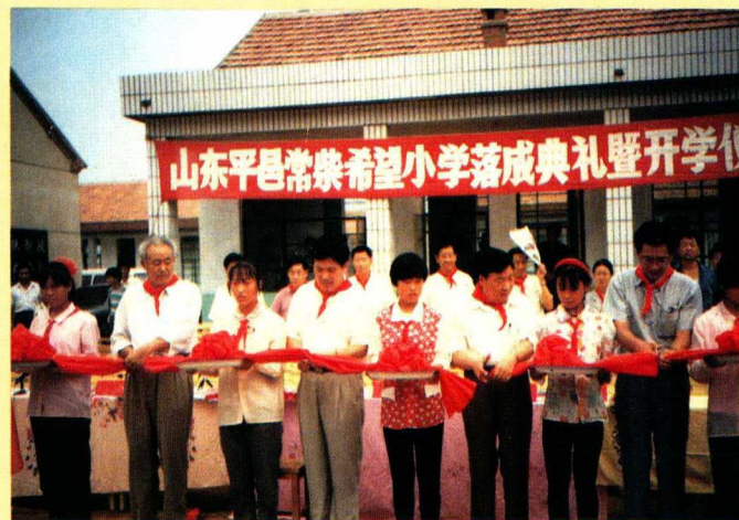
以真诚的爱心积极参与社会公益活动