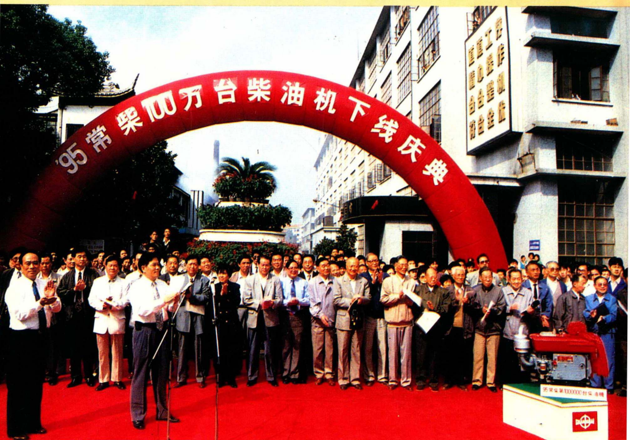
1995年10月16日常柴公司当年生产的第10万台柴油机下线

在长期的发展中，常柴始终坚持两个文明一起抓、两个成果一起要的指导方针，形成了一整套行之有效的思想政治工作体系；多年培育的常柴精神已成为促进常柴发展的精神财富；多年坚持的阵地建设、队伍建设，已使常柴的思想政治工作 and 经济建设互为协调促进，并形成了全新的运行机制。在这里，思想政治工作有目标、有措施、有考核、有组织、有队伍、有阵地，贯穿了常柴的昨天、今天和明天。