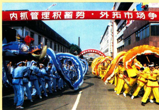
丰富多彩的文体活动