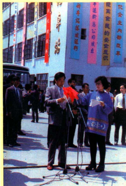
图为宝应新车站落成运行典礼。