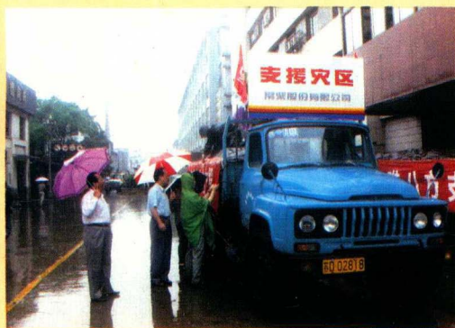
无偿支援灾区百台柴油机

1995年12月,常柴成功地组建了由200多家企业参加的常柴集团及其核心企业常柴集团有限公司,并成为省级十大企业集团之一。