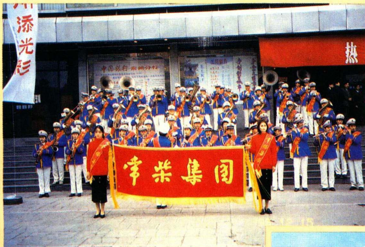
庆祝常柴集团成立

1995年12月,常柴成功地组建了由200多家企业参加的常柴集团及其核心企业常柴集团有限公司,并成为省级十大企业集团之一。