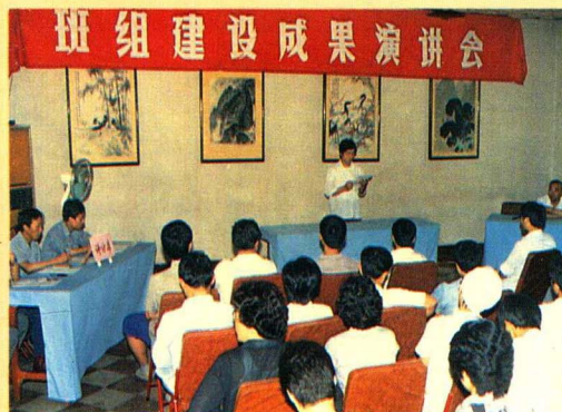
开展多种形式的职工教育活动