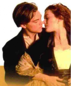
图 说 世 界