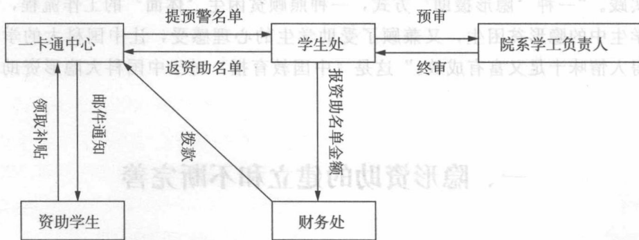
图 1 中国科大隐形资助工作初期的流程示意图