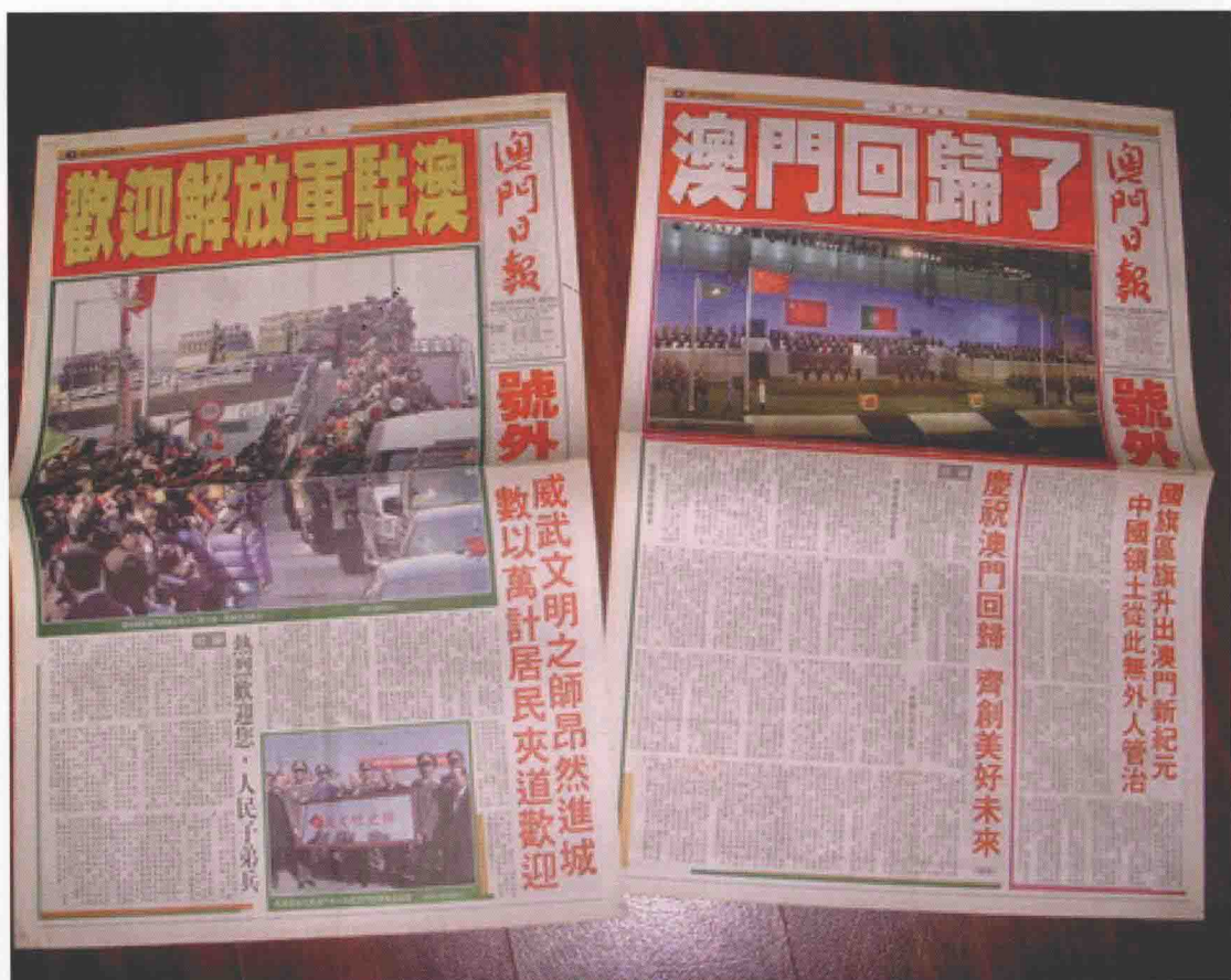
1999年12月19日澳门回归祖国的有关报导