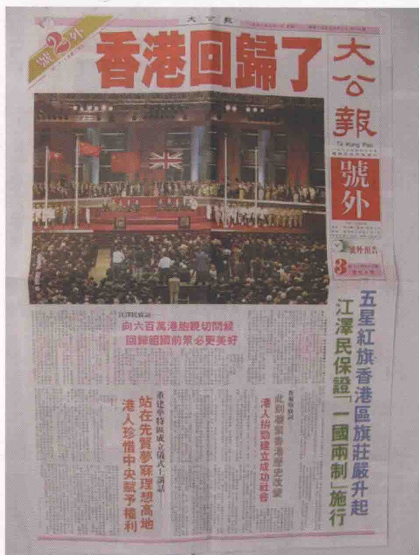
1997年7月1日香港回归祖国