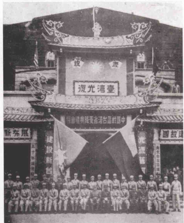
台湾光复典礼现场 (1945年10月25日)