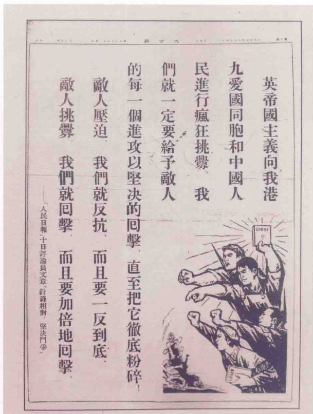
1967年“六七暴动”期间《大公报》摘录 《人民日报》评论员文章