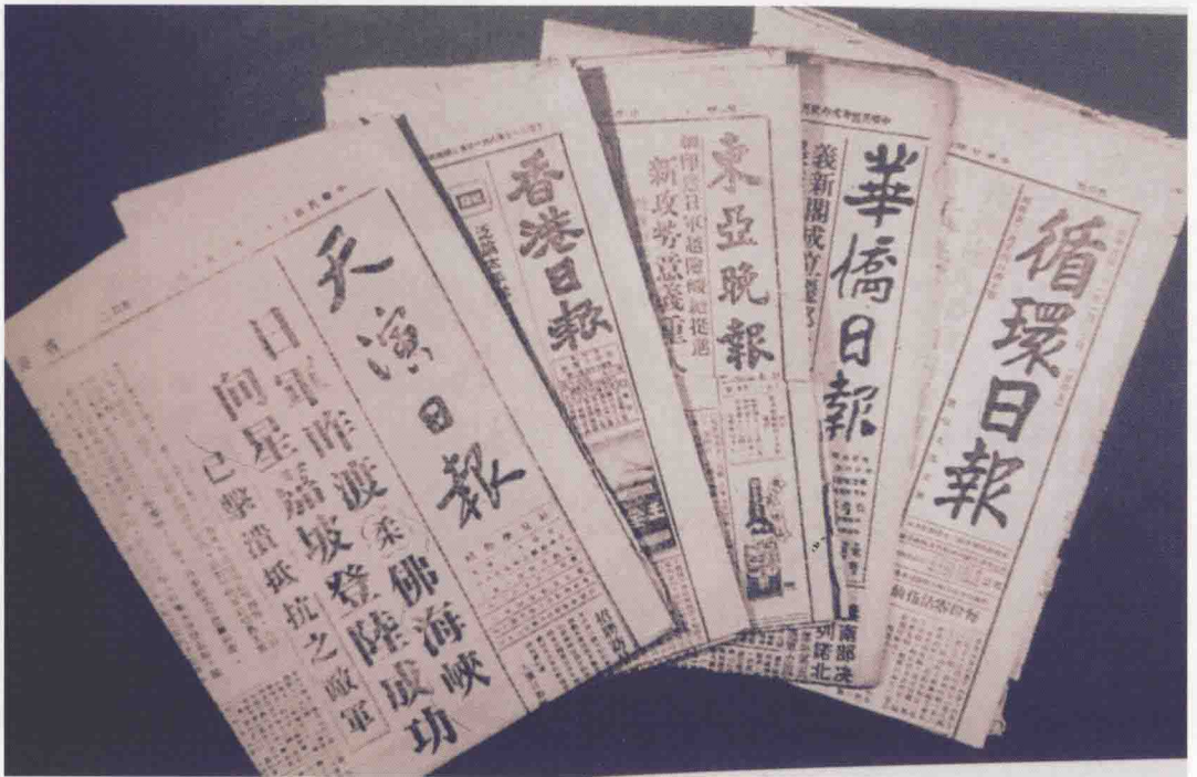
日本占领时期经香港占领地总督部批准出版的中文报纸