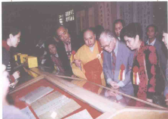
关山月大师与中国佛教协会副会长释明生大和尚参观手抄《六祖坛经》书法长卷