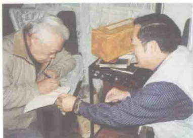
全国政协委员、中国佛教协会副会长周绍良题字书赠作者