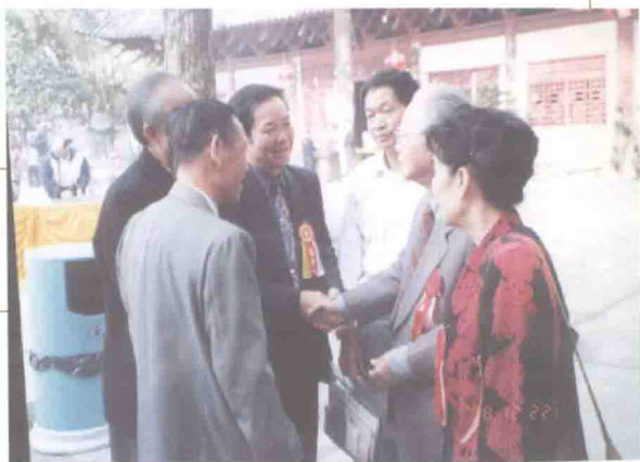
国画大师关山月祝贺作者手抄《六祖坛经》展出