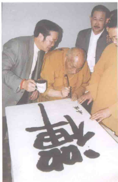
九十八岁的释本焕大和尚题字