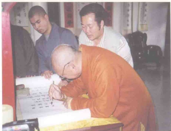
全国政协常委、中国佛教协会会长 释一诚大和尚为作者手抄《六祖坛经》长卷题字