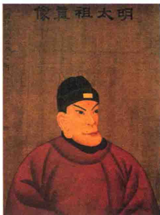
※ 明太祖朱元璋，农民出身的王朝开创者。