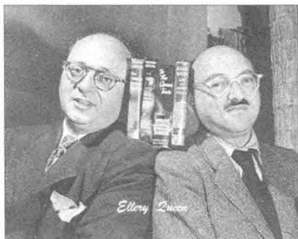
埃勒里·奎因 Ellery Queen