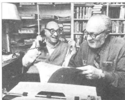
巴纳比·罗斯 Barnaby Ross ——埃勒里·奎因的面具

埃勒里·奎因的“悲剧系列”是全世界水平最高的系列推理小说之一。这四幕“悲剧”的精彩不仅仅限于故事本身，台前幕后的花絮时至今日依然是读者津津乐道的话题。