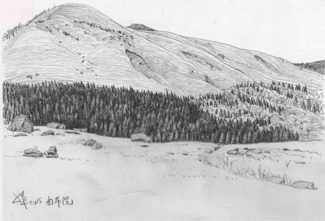
由布院 · 鉛筆 · 45x37cm · 2015 年