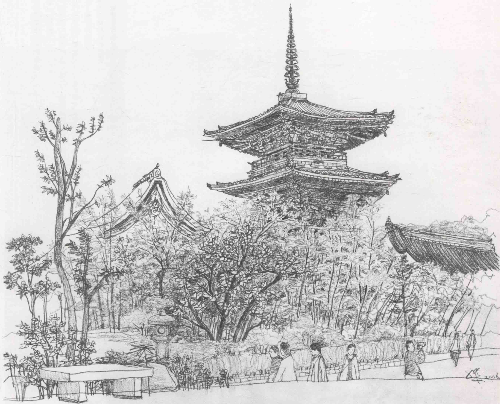
清水寺三重塔櫻花·鉛筆·45x37cm·2006年