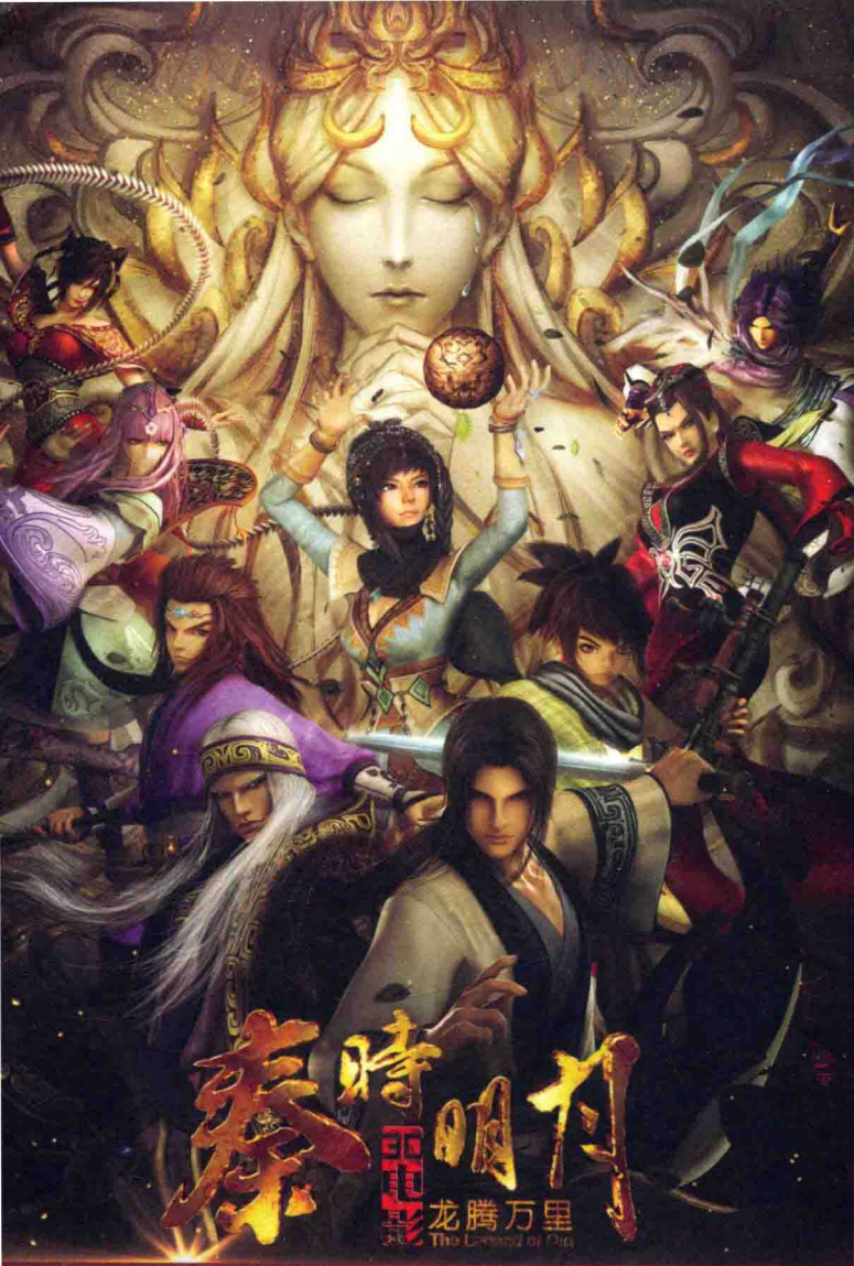
◆ 玄机大电影《秦时明月之龙腾万里》