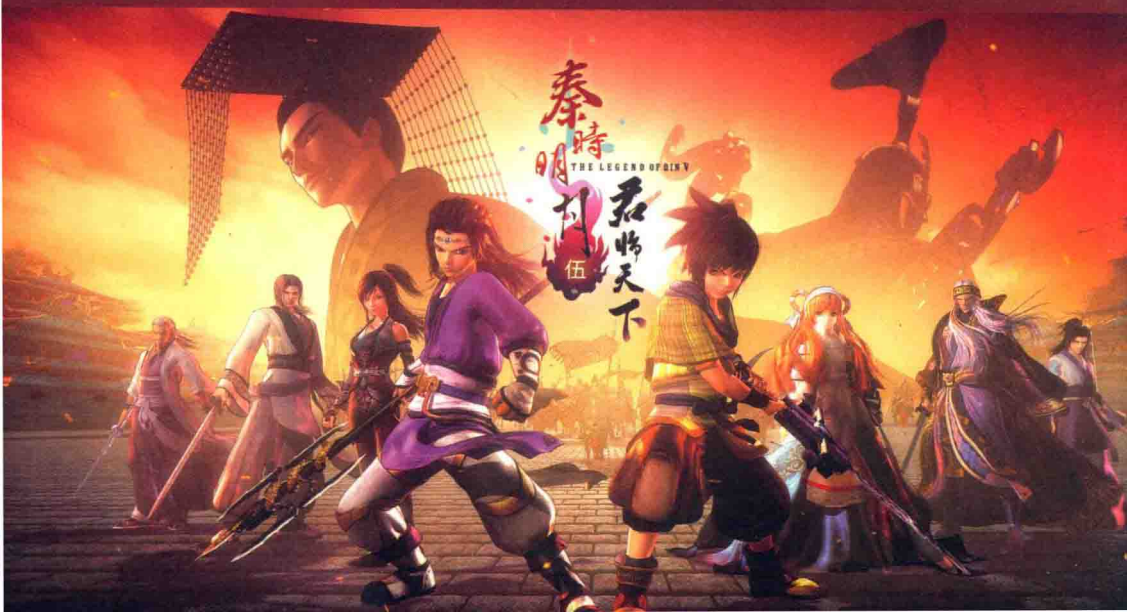
◆ 玄机科技旗舰品牌《秦时明月伍君临天下》海报（三大品牌“秦时明月”“天行九歌”“武庚纪”）