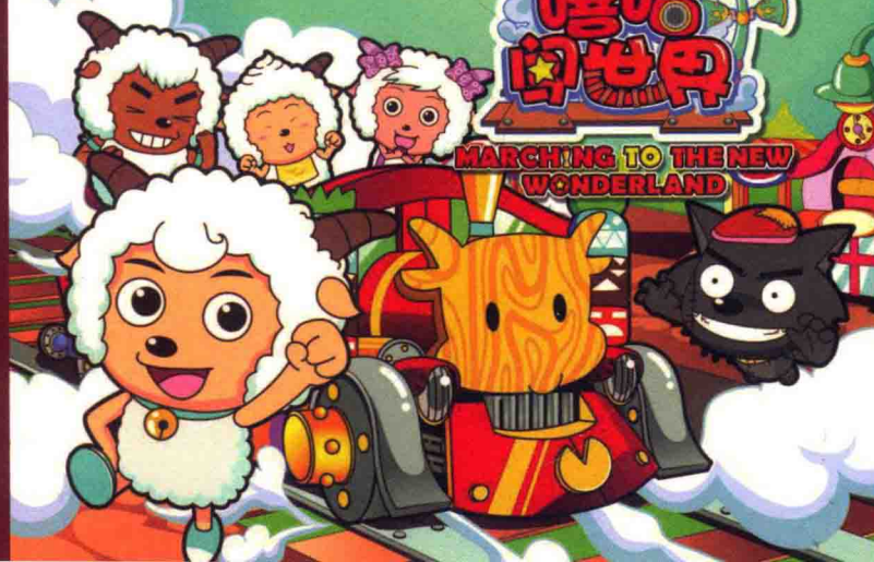
◆ 《喜羊羊与灰太狼之嘻哈闯世界》